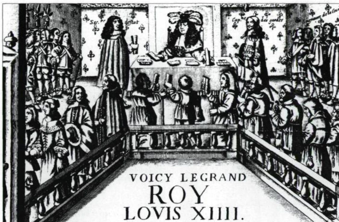
Sous l'Ancien Régime, le roi rend la justice à la Cour de France. Sur cette illustration, deux femmes se disputent un enfant.