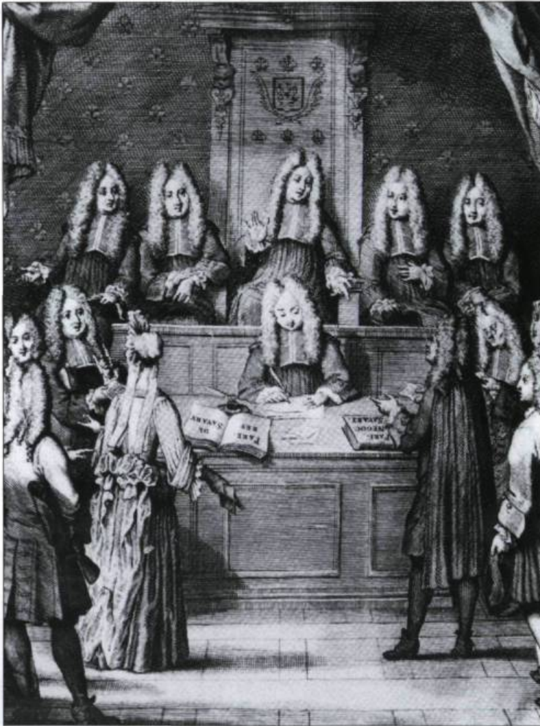
À l'instar du Conseil du commerce qui contrôle le négoce en France, la Nouvelle-France compte une instance juridique principale, la Prévôté de Québec.