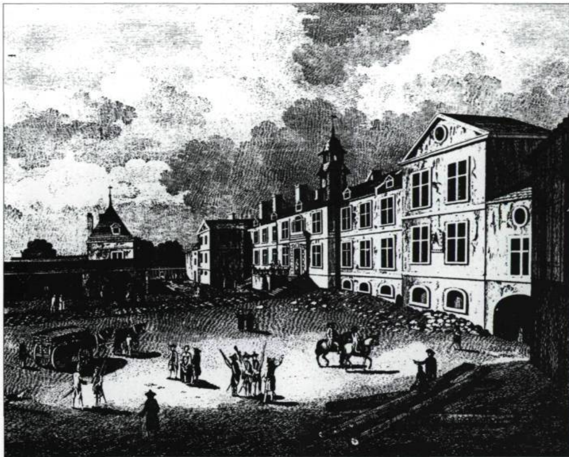
Ce détail d'une gravure de l'officier britannique Richard Short, vers 1760, montre l'emplacement du palais de l'Intendant qui abrite également la Prévôté de Québec. (De Volpi Québec, planche 15).