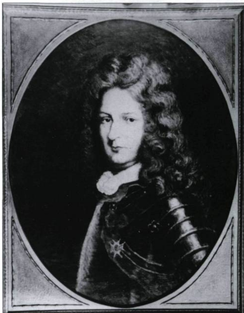
Pierre Le Moyne d'Iberville fut accusé par Jeanne-Geneviève Picoté de Belestre de l'avoir séduite et d'être le père de son enfant. Une ordonnance du Conseil Souverain de 1688 l'obligea à assurer la subsistance de l'enfant jusqu'à l'âge de 15 ans. (Archives nationales du Québec à Québec, collection initiale).

Toutes les jeunes filles n'ont pas droit à des dédommagements pour séduction. Seules celles