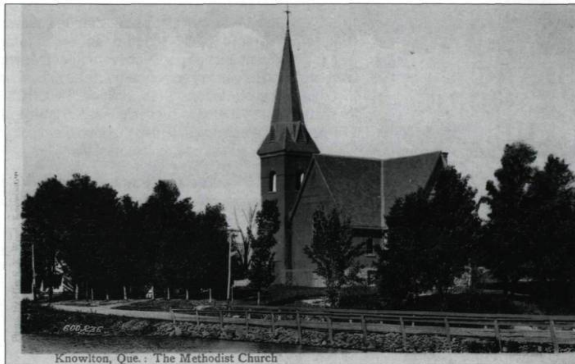
Même si la plupart des cartes postales restent anonymes, celles qui sont réalisées à partir des clichés de Sally Wood, telle cette église méthodiste de Knowlton, portent sa signature. (Collection Madeleine Marci).

du XX e siècle. En général, elles sont représentées comme des amateurs qui captent les grands moments de la vie pour les conserver comme souvenirs. Malgré cette représentation publicitaire, certains clubs photographiques leur restent inaccessibles.