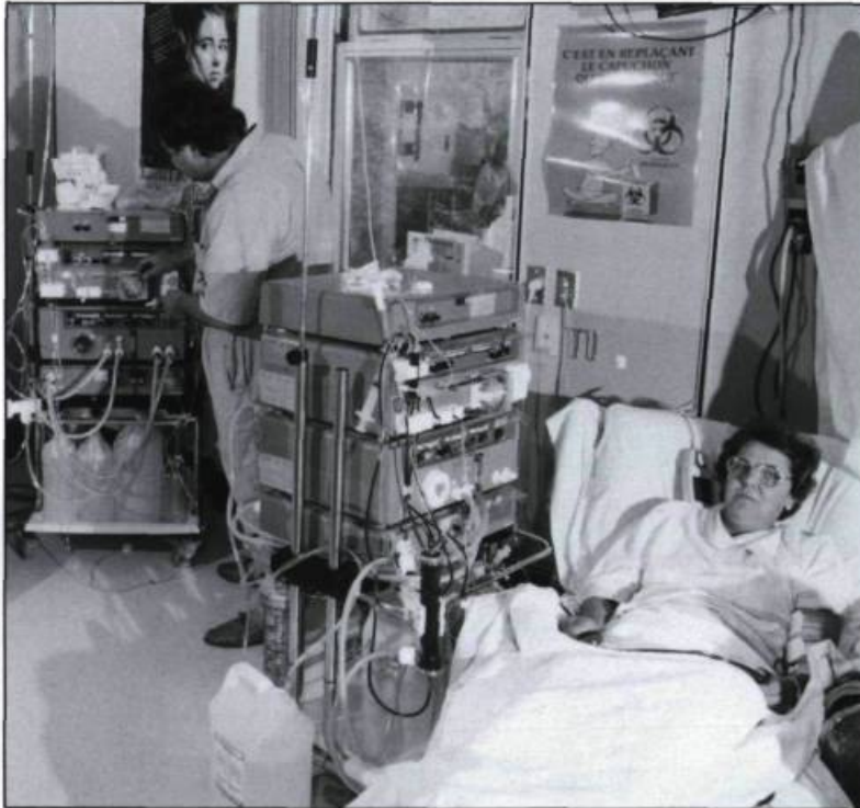
Patiente en hémodyalise.