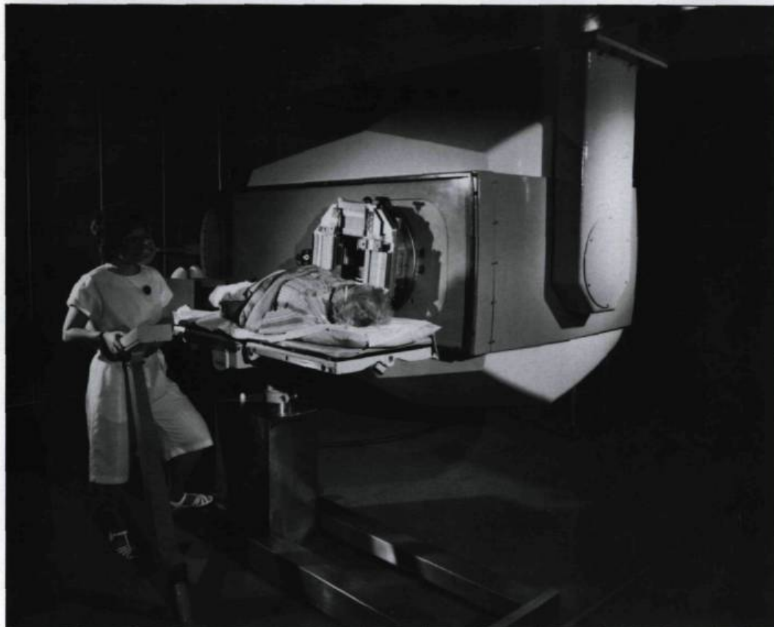
La recherche en cancérologie tient une place de premier plan à l'Hôtel-Dieu de Québec.

En vigueur dès 1972, la loi 65 sur l'assurance-hospitalisation ouvre les services hospitaliers à toute la population. À l'Hôtel-Dieu de Québec, l'espace manque pour les départements et les services. Les pavillons d'Aiguillon, Richelieu et du Précieux-Sang, ne suffisent plus.