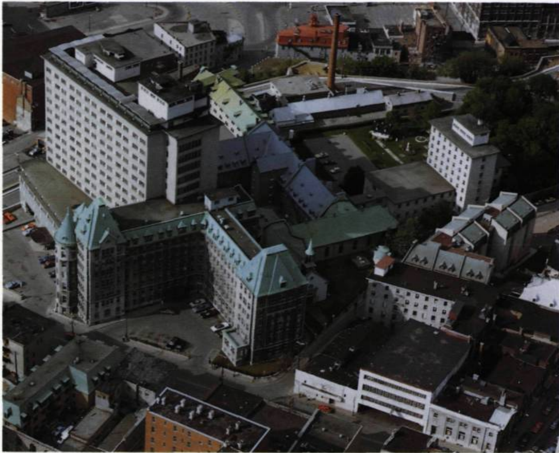
Vue contemporaine de l'Hôtel-Dieu de Québec. (Photographie médicale, Hôtel-Dieu de Québec).