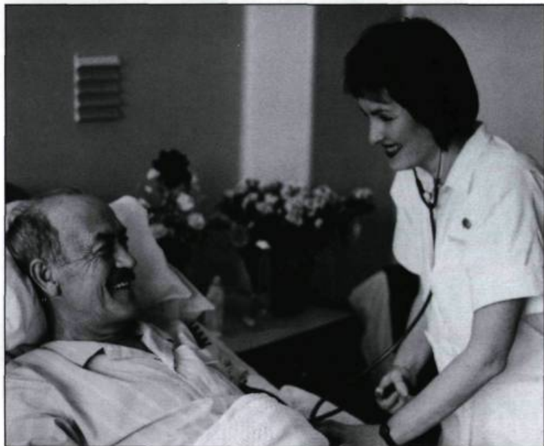
L'augmentation sans cesse croissante de sa clientèle amène l'Hôtel-Dieu à améliorer la qualité de son personnel et de ses équipements. (Photographie médicale, Hôtel-Dieu de Québec).

Entre 1950 et 1989, l'hôpital du Vieux-Québec connaît un grand essor qui se fait malgré tout dans le respect des grands principes de 1639. En 1954, une nouvelle charte crée l'hôpital universitaire. Sa mission reformulée comprend les soins aux malades, l'enseignement universitaire et la recherche médicale.