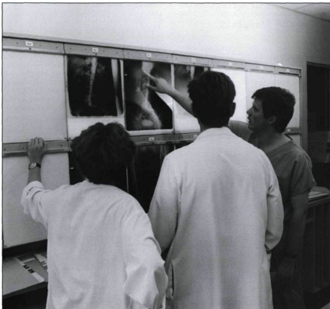
L'enseignement de la médecine représente l'une des grandes missions de l'Hôtel-Dieu de Québec.