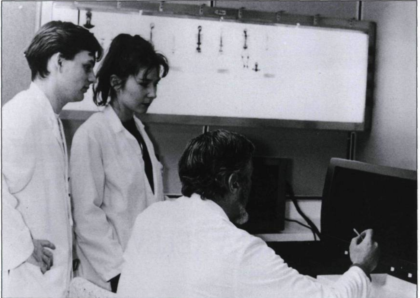
Jeunes chercheurs à l'écoute de leur professeur.