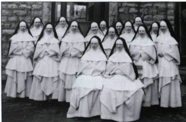
Groupes d'étudiantes inscrites à l'École des infirmières en 1939.

À cette époque, Ahern rencontre le docteur de Martigny et, à ses côtés, il s'initie aux rudiments de la médecine. Dès lors, ce jeune professeur découvre sa véritable vocation. En 1864, il s'inscrit à la faculté de médecine de l'université Laval.