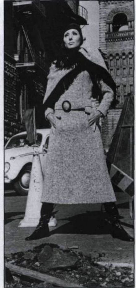
Robe manteau en tweed noir et blanc, avec grand châle frangé noir. Chapeau en cuir vernis noir. Collection prêt-à-porter automne-hiver 1969. (Photo Michel Robichaud Inc. Studio, Montréal).

occasions, alors que moi j'innovais en faisant des vêtements de jour, des tailleurs et des manteaux principalement, car c'est ce que je préférais faire. Je considérais que c'était plus important et plus logique de mettre de l'argent sur des vêtements que l'on porterait souvent, plutôt que sur une robe du soir que l'on porterait occasionnellement. C'est ce qui a fait mon succès, les gens ont commencé à reconnaître mes vêtements très dépouillés mais parfaitement coupés, différents de la tendance générale au Québec. C'est la presse qui a tout de suite déclaré que mon style s'approchait de ce qui se faisait de mieux en Europe.