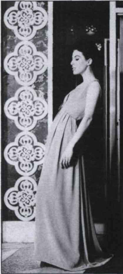
Robe de grand soir en crêpe de soie gris souris. Collection haute couture printemps-été 1963. (Michel Robichaud Inc. Studio, Montréal).