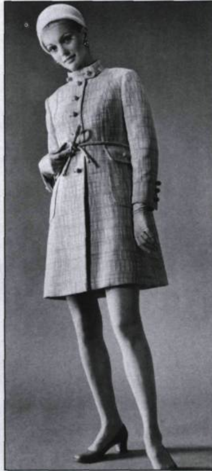
Été 1967.