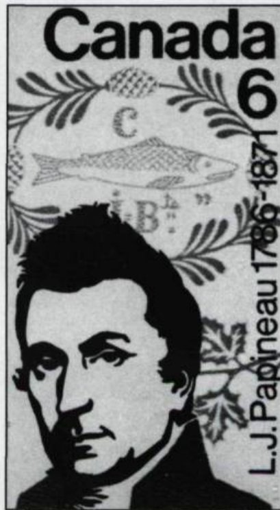
Timbre de 6 cents émis à l'occasion du centenaire de la mort de Louis-Joseph Papineau en 1971.

1838. Devant l'emblème du maskinongé qui figurait sur le drapeau des Patriotes de Saint-Eustache, un homme encore jeune,