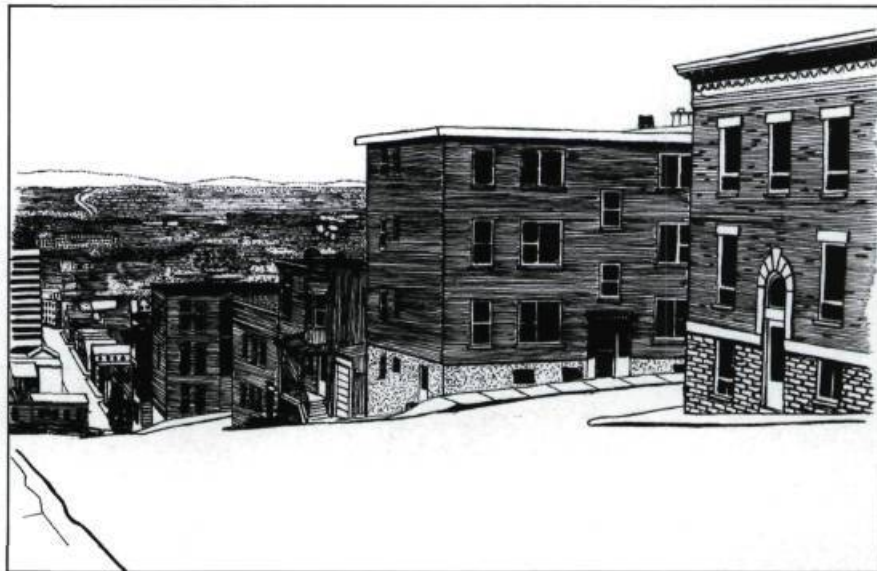
La côte Salaberry. (Dessin: Sylvie Bouffard).

Rues mangeuses de bruits et côtes à donner le vertige où traînaient les chevaux les passants et les fiacres tous les chemins sont des bateaux qui nous mènent vers l'aventure mais l'âge fuit plus loin que l'eau et tout devient caricature . . .