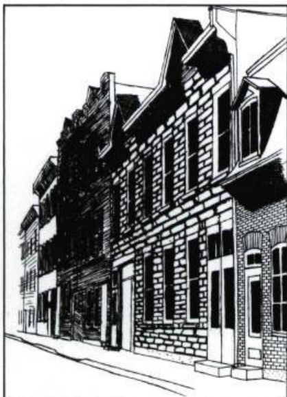
Vue de la rue Latourelle. (Dessin: Sylvie Bouffard).

Ma paroisse a 100 ans j'y suis née j'y habite à l'ombre de ses murs au coeur de son silence ce que j'étais ce que je suis trouve un écho!