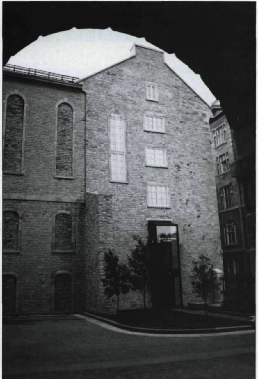
Le Musée du Séminaire de Québec, fondé en 1874, dans sa formule renouvelée en 1983. (Photo: Denis Bérubé).

Au cours des années, le Séminaire accroît son importance dans le domaine de l'enseignement et de l'éducation. Les prêtres-enseignants, formés souvent à Paris ou à Rome deviennent de véritables savants et les nombreux contacts qu'ils entretiennent avec la communauté scien-