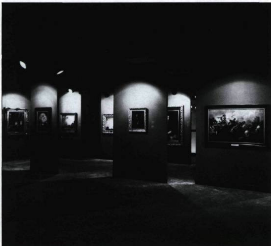
Entre la rose et l'épée. Salle des peintures européennes. (Photo: Pierre Soulard).

À partir de ce moment, le Séminaire aurait pu s'estimer satisfait et déclara-