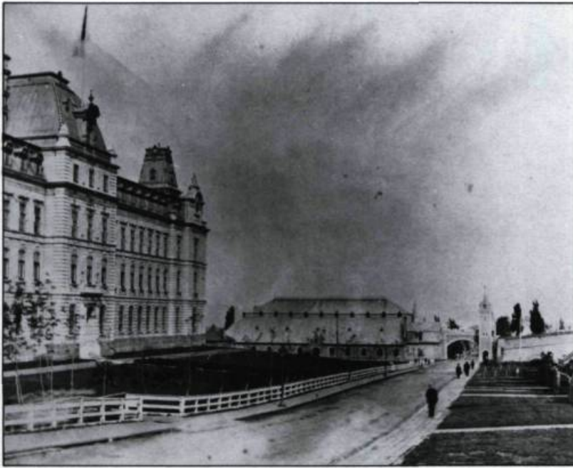
Cette représentation de l'aile sud du Parlement vers 1888 nous dévoile l'influence du style Second Empire. Son ornementation est toutefois plus dépouillée et plus réaliste. Ce pavillon latéral de l'édifice gouvernemental reprend les grandes lignes de la nouvelle aile du Louvre conçue au milieu des années 1850. (Inventaire des biens culturels, Québec).

les écrits des années 1860-1920, qui révèlent une ville plutôt anglaise. En fait, depuis les années 1920 et surtout depuis 1960, Québec a été entièrement «refrançaisée» pour être en mesure, en tant que capitale, de projeter une image conforme aux idéaux d'originalité et de souveraineté culturelles. Québec n'a donc pas été continuellement une ville française. Elle l'est redevenue par suite d'une concertation entre les autorités municipales et provinciales. Cette concertation n'est d'ailleurs rien d'autre que l'inscription, dans le paysage urbain, d'une campagne de re-francisation fondée sur un nationalisme politique et économique dont la Loi 101, adoptée en 1976 et décrivant le Québec français, n'est qu'un aboutissement logique.