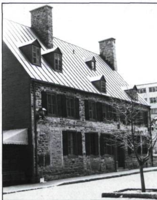
Maison Maillou, sise au 17 rue Saint-Louis, construite par l'architecte Jean Maillou en 1738. (Photo: Guy Giguère).

L'image française que projette le Vieux-Québec est donc fondée sur un ensemble de facteurs et de mouvements qui englobent quatre siècles d'histoire. Si la Nouvelle-France est le point de départ, ou le prétexte, qui a permis de construire dans le temps ce monument unique de la francophonie en Amérique du Nord, on constate aujourd'hui que cette image est largement le fait des attitudes historicistes des quelques constructeurs, architectes, urbanistes et hommes politiques des XIXième et XXIème siècles. C'est donc aussi l'action de ces quelques visionnaires que l'UNESCO vient de reconnaître en inscrivant le Vieux-Québec sur la liste des monuments et sites du patrimoine mondial; on leur doit d'avoir inscrit la ville dans notre siècle en évitant le piège du musée d'architecture. ♦