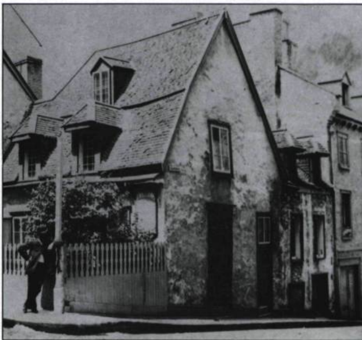
La maison Jacquet, sise rue Saint-Louis. (Ministère des Affaires culturelles).

C'est cette ville classique, déjà connue et fréquentée en raison de ses monuments, que l'ère industrielle va considérablement modifier. Mais alors que partout dans la province, et surtout à Montréal, c'est l'architecture dite «victorienne» qui