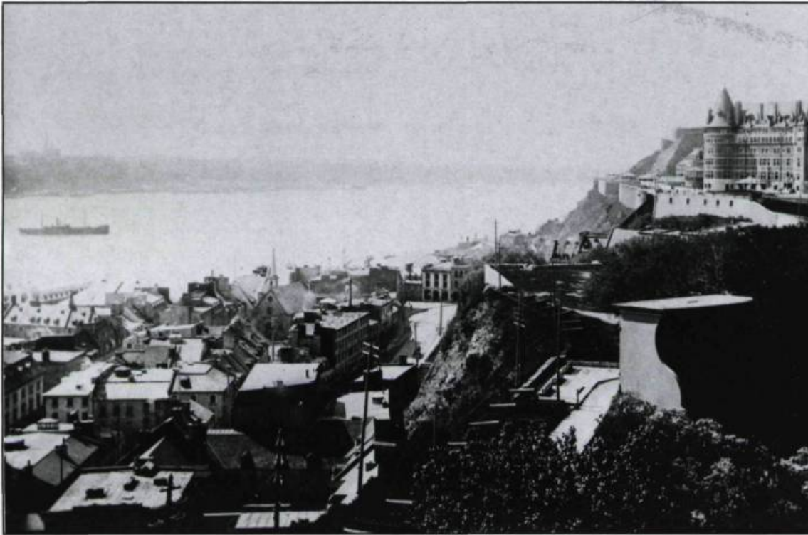
Vue de la basse-ville prise de l'Université Laval vers 1895. On y aperçoit la première aile du Château Frontenac..