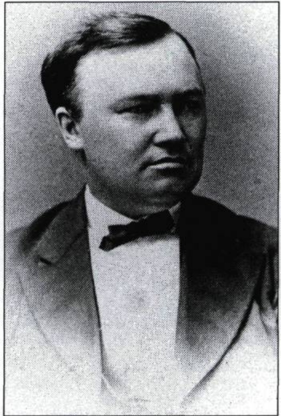
Photographie de Eugène-Étienne Taché. 1870. (Coll. privée).

trionphe, les architectes de Québec, en particulier Joseph-Ferdinand Peachy et Eugène-Étienne Taché, vont plutôt s'inspirer de modèles français.