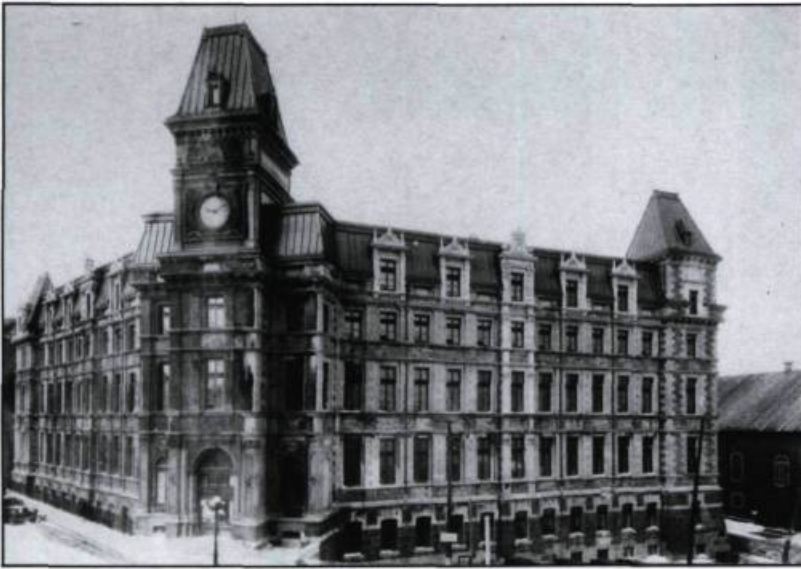
Deux des belles réalisations d'Eugène Taché: le Palais de justice (photographié après 1922) et le Manège militaire, carte postale, s.d. Pruneau et Kirouac. (Archives de la ville de Québec).