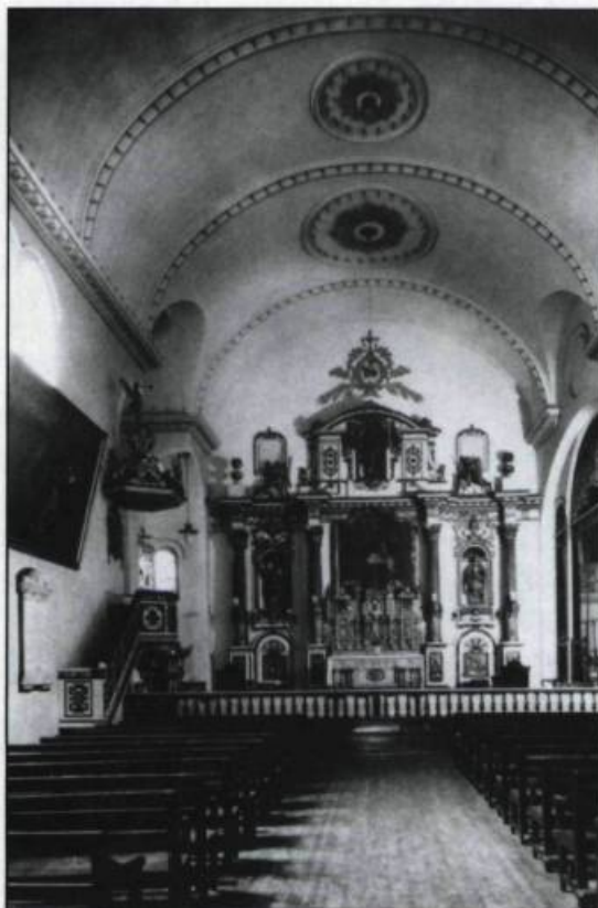
Retable de la chapelle des Ursulines sculpté par Pierre-Noël Levasseur. (Collection initiale, Archives nationales du Québec, Québec).

Bien au-delà du milieu du XIX ème siècle, Québec est donc demeurée une ville traditionnelle dont l'image globale témoignait encore de l'héri-