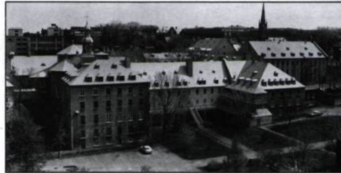
Couvent des Ursulines, aile Sainte-Famille.

Le tracé initial de la ville – que les trames urbaines uniformisées de l'Amérique du Nord du XIX ème siècle ont contribué à isoler, donc à singulariser – conserve néanmoins quelques traces de l'occupation française. Il subsiste au monastère des Ursulines deux étages des ailes Saint-Augustin et Sainte-Famille, construites dès la fin du XVII ème siècle, ainsi qu'un retable en bois sculpté du XVII ème siècle, entre autres. Mais ces bâtiments ont été, aux XIX ème et XX ème siècles, exhaussés, transformés, inscrits dans un ensemble plus vaste. Le Séminaire et l'Hôtel-Dieu ont connu le même traitement, ce qui réduit à des fragments l'héritage de la Nouvelle-France. Dans la catégorie de l'architecture domestique, il ne subsiste aucune maison complète du Régime français. Il y a bien sûr la petite maison Jacquet, construite peu avant 1760, la maison Jolliet de 1686, la maison Maillou de 1734, mais aucune n'a cessé d'être modifiée au fil des ans.