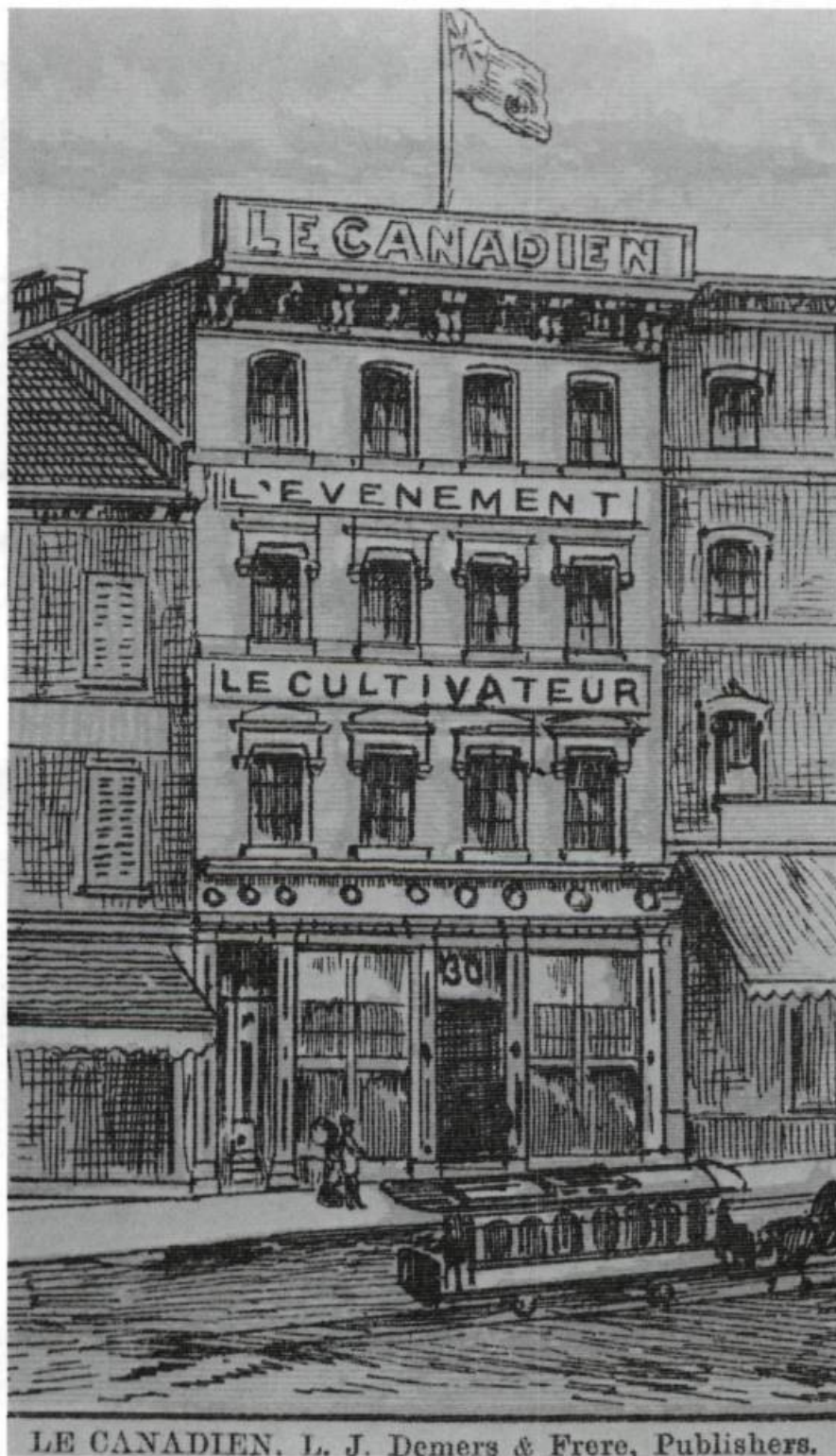
Siège social des journaux Le Canadien, l'Événement et le Cultivateur situé au 30 Côte de la Fabrique.

Pareille concentration de talents divers reposait sur la densité de la population coincée dans un espace extrêmement restreint et délimité. Le Vieux-Québec, enfermé dans ses fortifications, dont les portes ne furent élargies ou supprimées qu'après 1867, dans la majorité des cas, et d'où le Parlement n'était parti qu'après l'incendie du palais épiscopal qui l'abritait en 1883. Le Château Frontenac s'appelait encore le château Saint-Louis et servait d'école normale, le presbytère de Notre-Dame de Québec et la Basilique revêtaient quasi autant d'importance que l'Archevêché, à la veille de devenir palais cardinalice; le bureau de poste était alors non seulement le plus important mais aussi presque le seul; le Séminaire, les Ursulines, les Jésuites, l'Hôtel-Dieu (seul hôpital à Québec avec celui de la Marine) et l'hôtel de ville, même situé rue Saint-Louis,