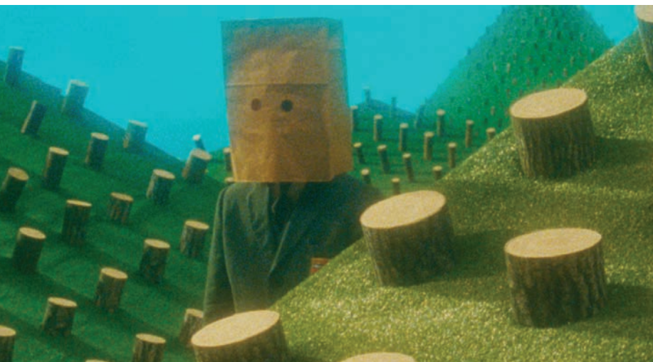
Une scène du film The Twentieth Century qui illustre l'inventivité de la direction artistique.