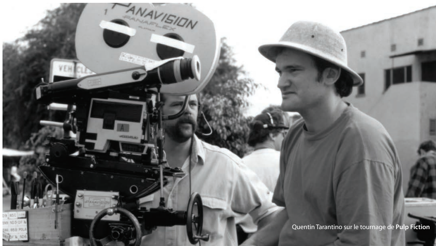
Quentin Tarantino sur le tournage de Pulp Fiction

Ce dernier ne se gêne d'ailleurs pas pour réécrire l'Histoire en faisant mourir tous les cadres du Parti nazi, mettant de facto fin à la guerre en 1944, dans Inglourious Basterds , ou en faisant exploser les premiers Klansmen dans Django Unchained , après une scène hilarante révélant les difficultés de chevaucher en portant une cagoule. Le style de Tarantino en est un où la liberté narrative ne connaît aucune limite; c'est ainsi que même après neuf films, il parvient toujours à surprendre le spectateur, qui ne peut jamais prévoir ce que le réalisateur va inventer cette fois.