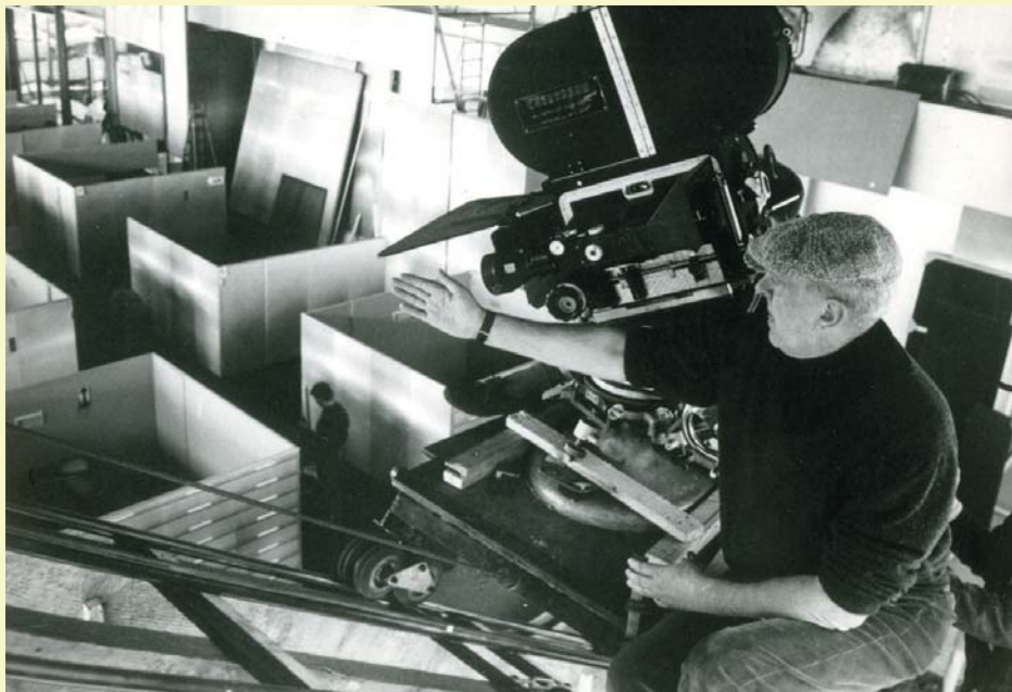
Jacques Tati sur le tournage de Playtime