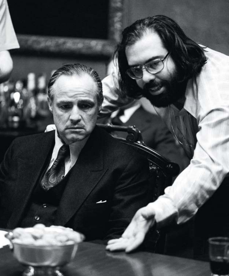
Francis Ford Coppola dirigeant Marlon Brando

la grande histoire de l'Amérique, ouvre la voie aux expérimentations scénaristiques des années 1990, avec Quentin Tarantino, David Fincher et Christopher Nolan, qui vont à leur tour manipuler les genres et la narration, toujours avec cette même tension entre film d'auteur et film grand public, tension que The Godfather a en partie instituée et, en fin de compte, déjouée — l'autre principal instigateur de cela demeure Alfred Hitchcock, dans la filmographie de qui se profilent également de tels éclats de génie pourtant produits à l'intérieur même du système hollywoodien.