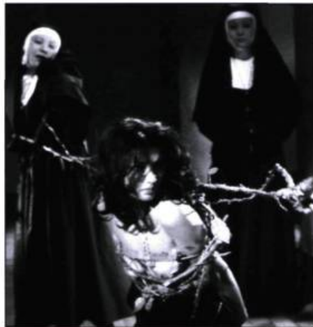
School of the Holy Beast

School of the Holy Beast demeure également un classique du cinéma d'exploitation japonais, c'est-à-dire un film qui s'insère dans un contexte prédéfini (un couvent, dans le cas échéant) tout en intégrant nudité, perversité et commentaires politiques. Force est d'admettre que pour intégrer ces différents éléments avec succès, il faut confier le travail à un réalisateur talentueux qui regorge d'imagination, et