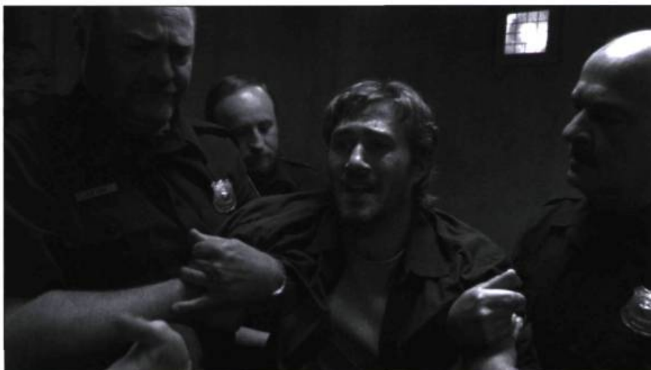
Manners of Dying