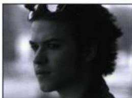
Les différents looks de Zachary : Bruce Lee, David Bowie et Sid Vicious

« À l'époque, Bowie ose ressembler à une femme. Et c'est dans sa chambre, secrètement, en écoutant David Bowie, que Zac assume ses désirs. »