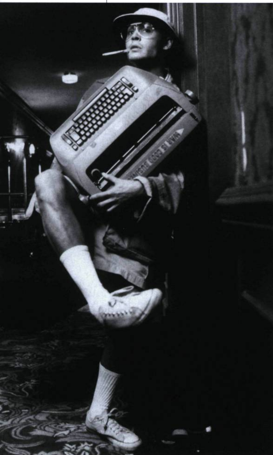
Johnny Depp dans Fear and Loathing in Las Vegas

réduite aux affirmations de Raoul en voix off , formulées entre deux doses de LSD. Le cinéaste préféra manifestement miser sur l'aspect tape-à-l'œil de l'espace américain vu à travers les yeux (rouges...) de Duke et Gonzo. En fait, le contenu et la forme de Fear and Loathing in Las Vegas se fondent en une symbiose de l'excès: excès des hallucinations (rarement lucides demeurent les personnages), excès des effets de style (surenchère d'images distordonnées, de gros plans et de panoramiques accélérés) et excès des clins d'œil (on pense trop souvent aux Doors et à Natural Born Killers d'Oliver Stone; quant aux apparitions éclair de Mark Harmon, Christina Ricci et... Thompson lui-même, elles ne génèrent que bien peu d'enthousiasme). Gilliam n'a tout simplement pas su trouver une véritable ligne directrice afin de structurer les délires de l'auteur — qui, s'ils parviennent à saisir l'aspect scabreux du roman, finissent par lasser — et injecter au tout une certaine distance et un peu d'humour.