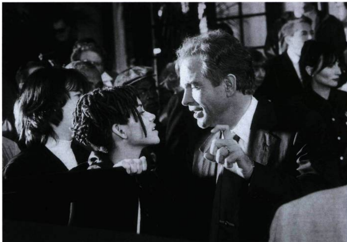
Halle Berry et Warren Beatty dans Bulworth

Dans Bulworth , l'humour est véritablement au rendez-vous. Bien entendu, les dialogues du film s'avèrent très savoureux. On se délecte en écoutant les