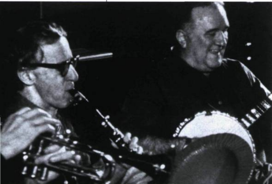
Woody Allen dans Wild Man Blues

Woody dans tous ses états, face à ses petites et grandes angoisses, ainsi que sa gêne relative face à toute cette admiration qu'il suscite chez les cinéphiles et critiques européens. Par la bande, on assiste à quelques tranches de vie du cinéaste et de sa nouvelle femme, Soon-Yi Previn.