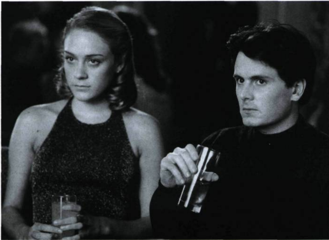
Chloë Sevigny et Chris Eigeman dans The Last Days of Disco

Whit Stillman est un cinéaste privilégiant un style au rythme lent axé sur de multiples dialogues, dont le conformisme autant en ce qui a trait aux idées qu'à la dynamique globale peut rebuter. En fait, The Last Days of Disco ne pêche non pas par excès, mais par conservatisme. La caméra suit ainsi paresseusement les allées et venues des personnages, et ne vient soutenir en aucun temps la mince progression du récit. Les thèmes abordés ne sont exposés que le temps de quelques répliques anodines qui n'offrent qu'une réflexion en surface de cette période transitoire. En ce sens, si Stillman aborde l'émancipation gaie, ce n'est qu'avec Des tentant de persuader son amie de son homosexualité récente afin de masquer son infidélité, puis quelques danseurs légèrement vêtus de cuir à la discothèque. Quant à la nouvelle situation professionnelle des femmes, elle est précipitée avec les promotions/démotions d'Alice et de Charlotte. Et que dire du déclin de la révolution sexuelle, à peine perceptible dans la relation éphémère d'Alice et de Tom (Robert Sean Leonard, qui, malheureusement, ne fait que passer), un avocat dénigrant les «filles faciles». Ainsi, à force de prendre des raccourcis, Stillman trébuche et n'offre qu'une ébauche de son sujet.