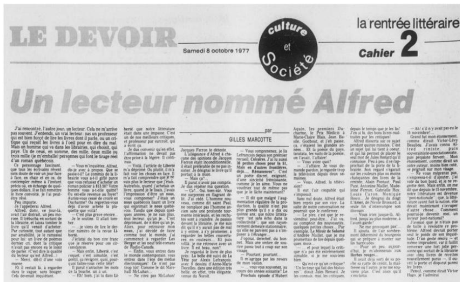
Gilles Marcotte, « Un lecteur nommé Alfred » (1977), Extrait du Cahier « La rentrée littéraire », Le Devoir , 8 octobre 1977, p. 17