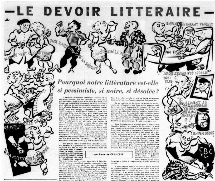
Pierre de Grandpré, « Pourquoi notre littérature est-elle si pessimiste, si noire, si désolée? » (1958), Extrait du supplément « Le Devoir Littéraire », Le Devoir , samedi 15 novembre 1958, p. 17

vertu duquel cette littérature se caractériserait par un constitutif manque, un défaut majeur et transversal. Je subodorais en effet que la récurrence, dans les essais critiques, universitaires, des hypothèses englobantes marquées par la négativité, reposait sur un discours plus large.