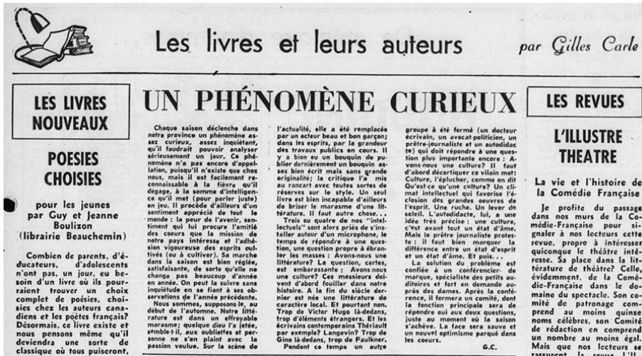
Gilles Carle, « Un phénomène curieux » (1955), Extrait de la rubrique « Les livres et leurs auteurs », Le Devoir , samedi 17 septembre 1955, p. 15