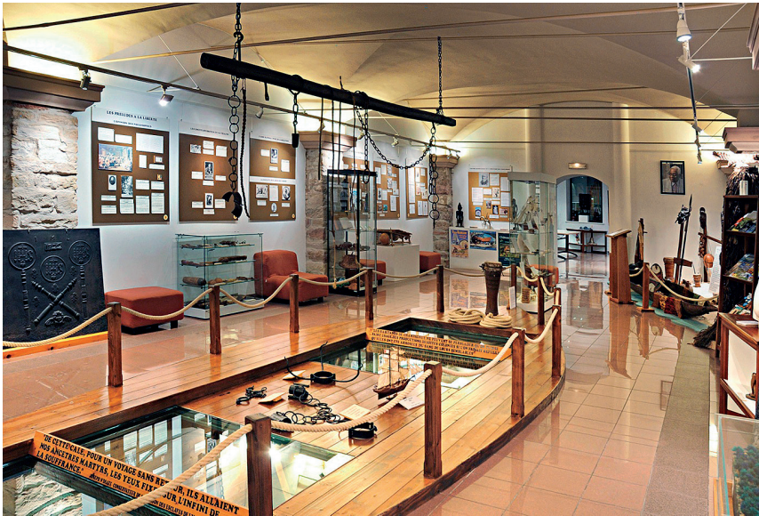
Vue générale de la salle consacrée à l'esclavage 8 .

Autour de l'article 29, s'élabore une présentation détaillée de l'esclavage des Noirs et du long chemin conduisant à son abolition dans les colonies françaises le 27 avril 1848.