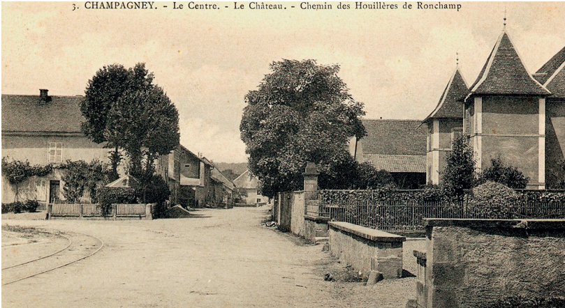
Le Château Priqueler.