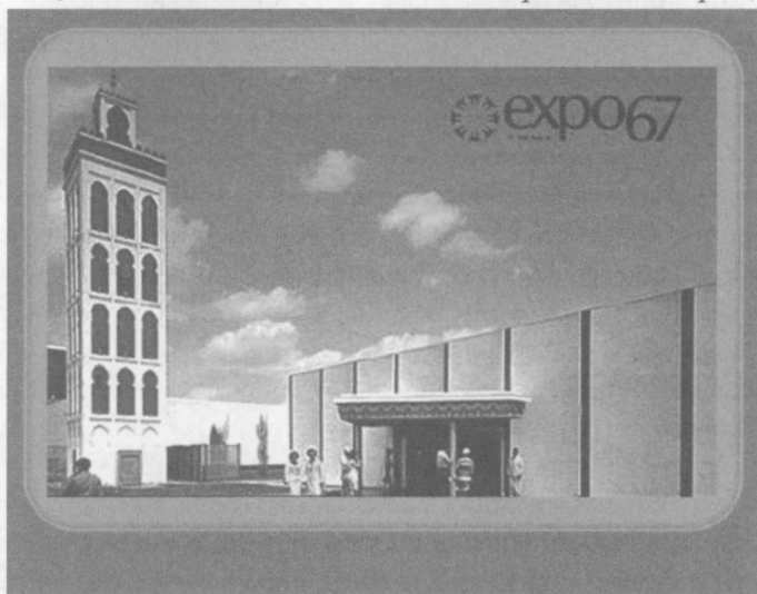
FIG. 3 : Pavillon du Maroc