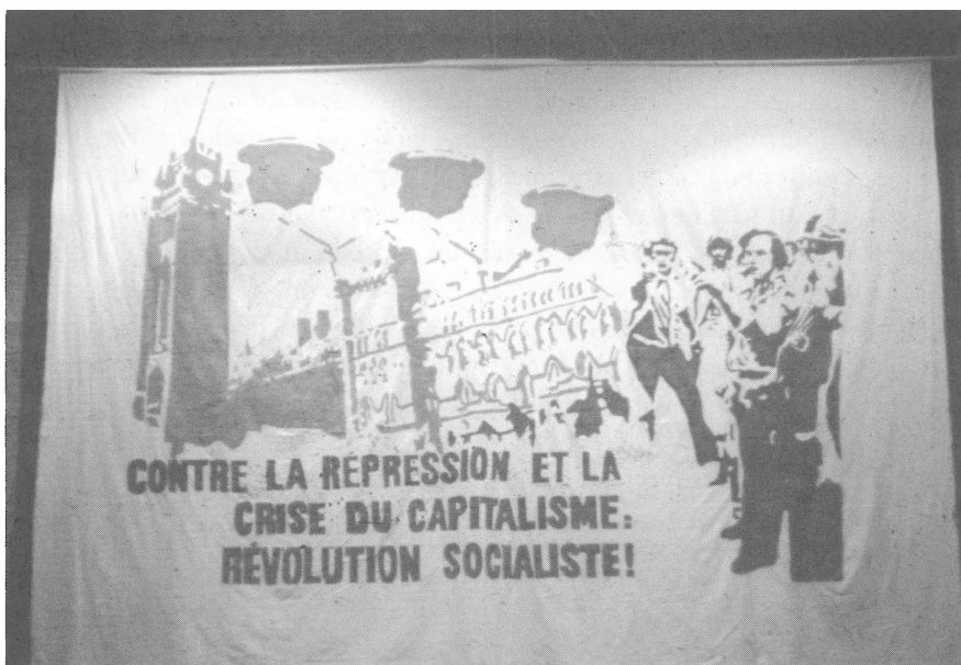
6. Groupe 1 er mai Contre la répression 1978 Acrylique sur toile