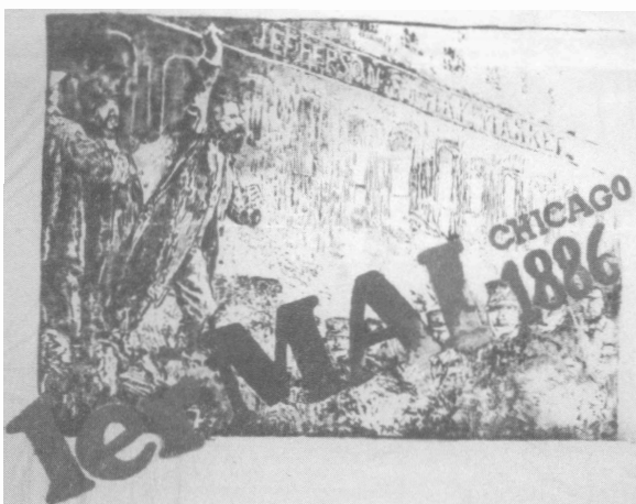
4. Groupe 1 er mai. Le 1 er mai 1886 1978 Encre sur toile