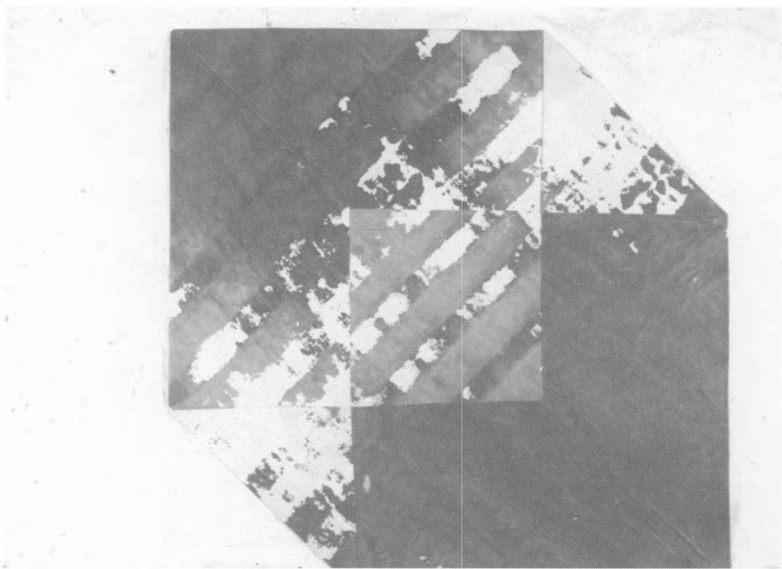
10. Marcel Saint-Pierre Replis n° 20 1982 Acrylique sur toile

qui mettait en relation des éléments par trop complexes, devait être défendu avec acharnement, voire même abandonné. C'est pourquoi, une fois passée l'excitation de la résolution des problèmes techniques nouveaux, ceux qui au sein du groupe avaient une pratique un tant soit peu substantielle de la peinture en revinrent rapidement à un travail d'atelier « individuel ».