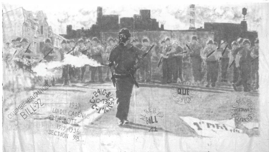
7. Groupe 1 er mai Répression du mouvement ouvrier 1978 Acrylique sur toile