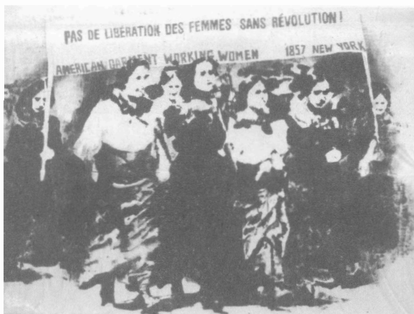
3. Groupe 1 er mai. 8 mars 1857 1978 Encre sur toile