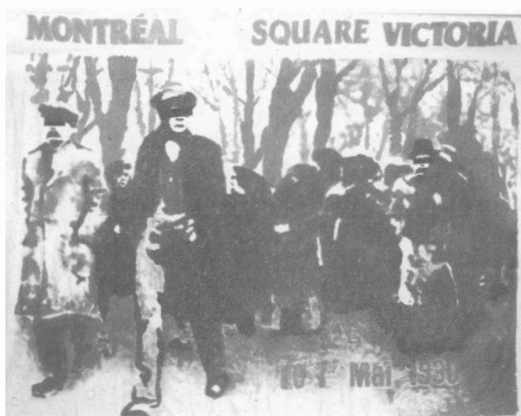
5. Groupe 1 er mai. Montréal, Square Victoria, 1 er mai 1930 1978 Acrylique sur toile