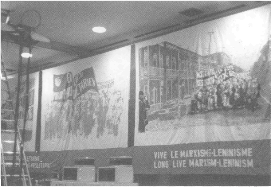
2. Groupe 1 er mai .

Vue sur l'accrochage de bannières pour un événement public du groupe En Lutte!