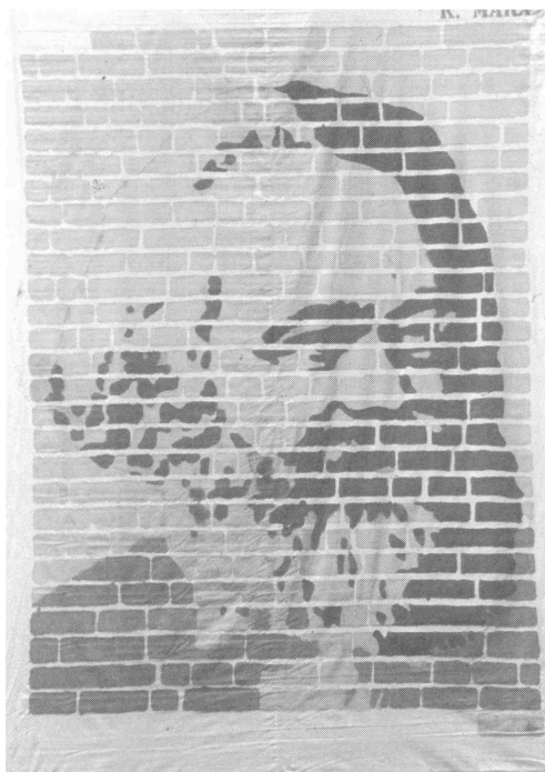
8. Groupe 1 er mai Marx 1979 Acrylique sur toile

Contre la répression (ill. 6) où un photomontage de photos de la grève de la Robin Hood, d'un alignement de policiers et des parlements de Québec et d'Ottawa visait à créer une chaîne associative « État-répression/opposition ouvrière » chargée « d'illustrer » d'une manière qu'on espérait pas trop stéréotypée, le mot d'ordre imposé par l'organisation lequel est reproduit au bas de la bannière (voir aussi ill. 7).