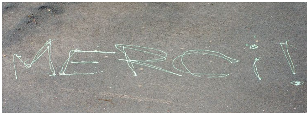
Le collectif d'À bâbord! remercie grandement Martine Delvaux pour ces années de contribution. Bonne route!