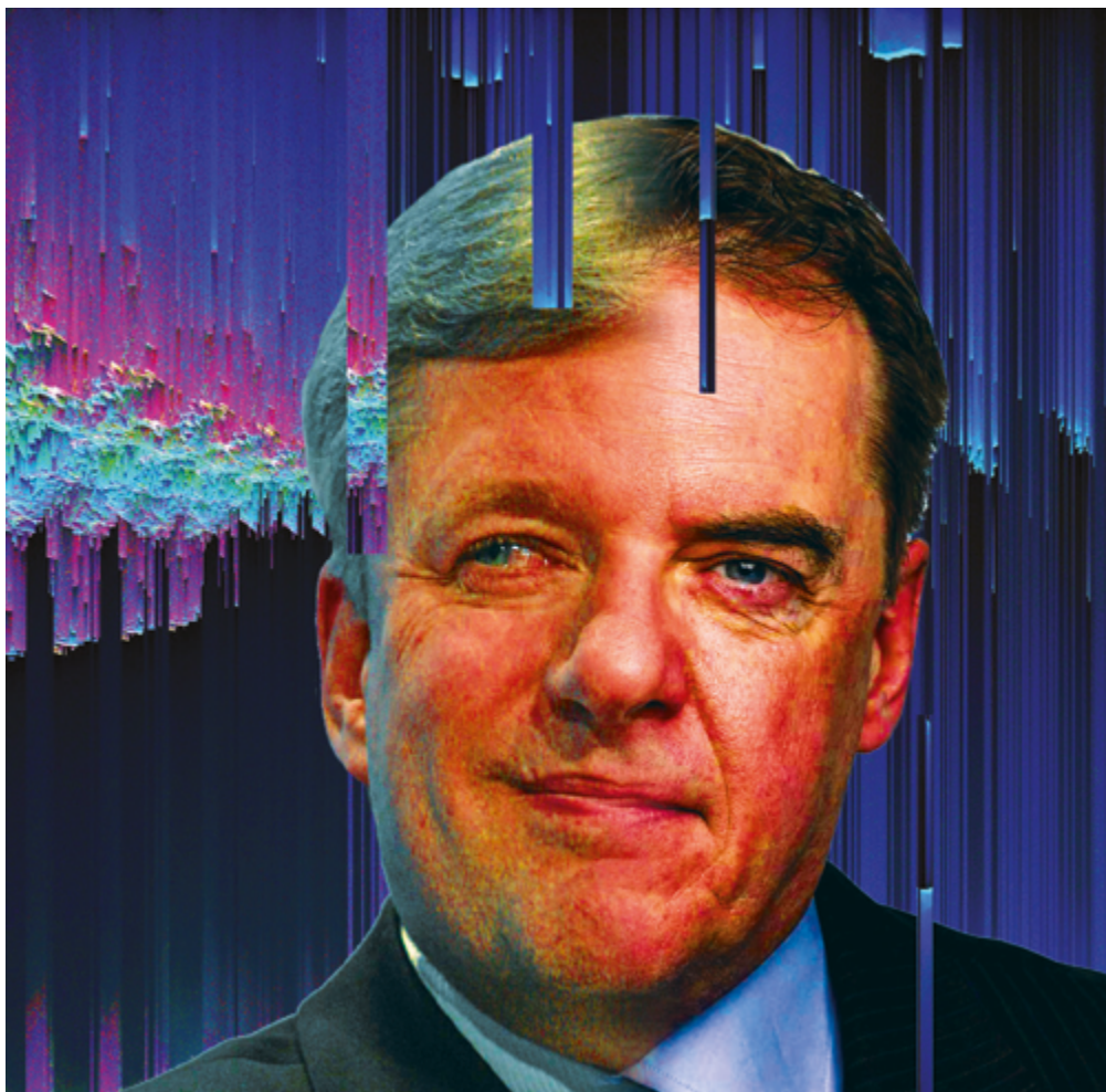
Le glitch HarpScheer.

manière. Aussi, même si certains électeurs de l'Ouest décident de rester chez eux lors de la prochaine élection, cela ne coûtera pas beaucoup de sièges au PCC.