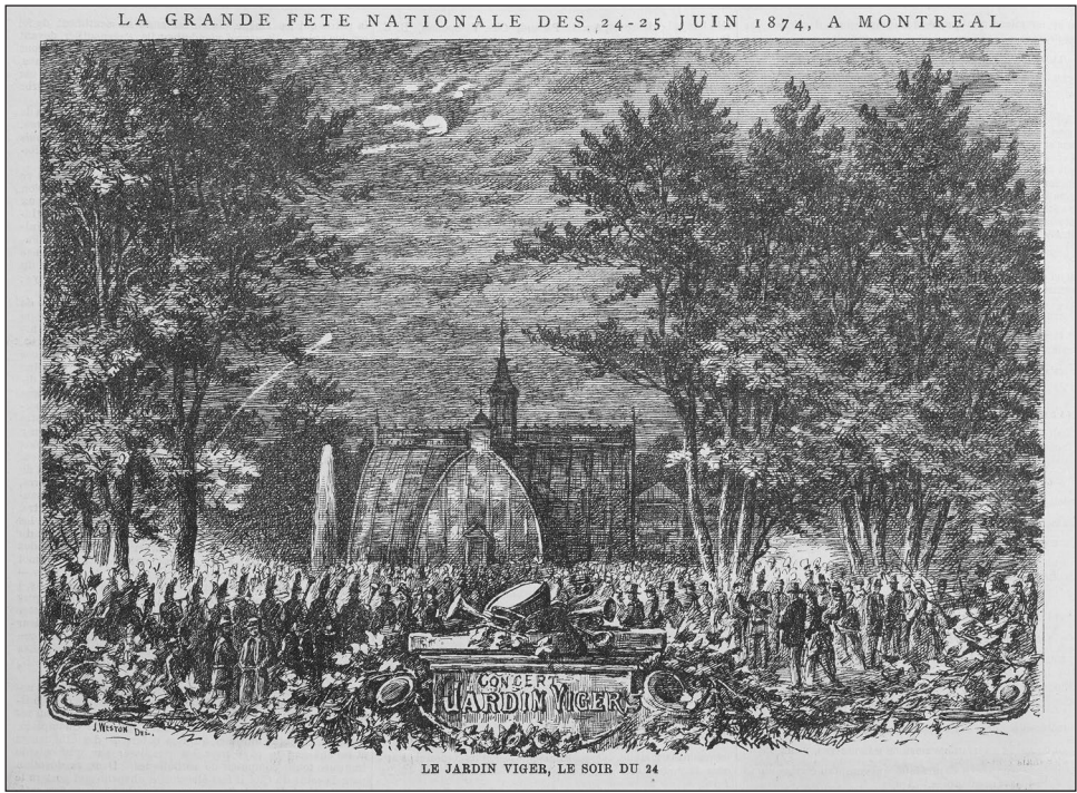
Figure 2 : La grande fête nationale des 24-25 juin 1874, à Montréal. Le jardin Viger, le soir du 24. L'opinion publique , 2 juillet 1874

construite dans le secteur ouest (1963-1966) et l'autoroute Ville-Marie reliant l'est à l'ouest éventre le secteur (1976). Ces aménagements modernes ne sont pas sans conséquence pour le quartier et le square: plus de 3 300 familles sont expropriées, des arbres sont abattus, des équipements urbains sont déplacés ou détruits (Bednarz 2013). Autour du square, les édifices des côtés sud et nord sont vidés et l'autoroute émerge du côté est. Le quartier ne possède plus la masse démographique qui lui permet d'offrir de l'animation dans le square. Le secteur prend les apparences d'un no man's land entre le Quartier latin, au nord, et le Vieux-Montréal, au sud, et entre le nouveau centre-ville anglophone, à l'ouest, et les secteurs ouvriers francophones, à l'est (Choko 1990). Historiques et nécessaires, la Maison du Père, le Old Mission Brewery et l'Accueil Bonneau, trois organisations qui viennent en aide aux plus démunis, comptent alors parmi les institutions les plus importantes du quartier.