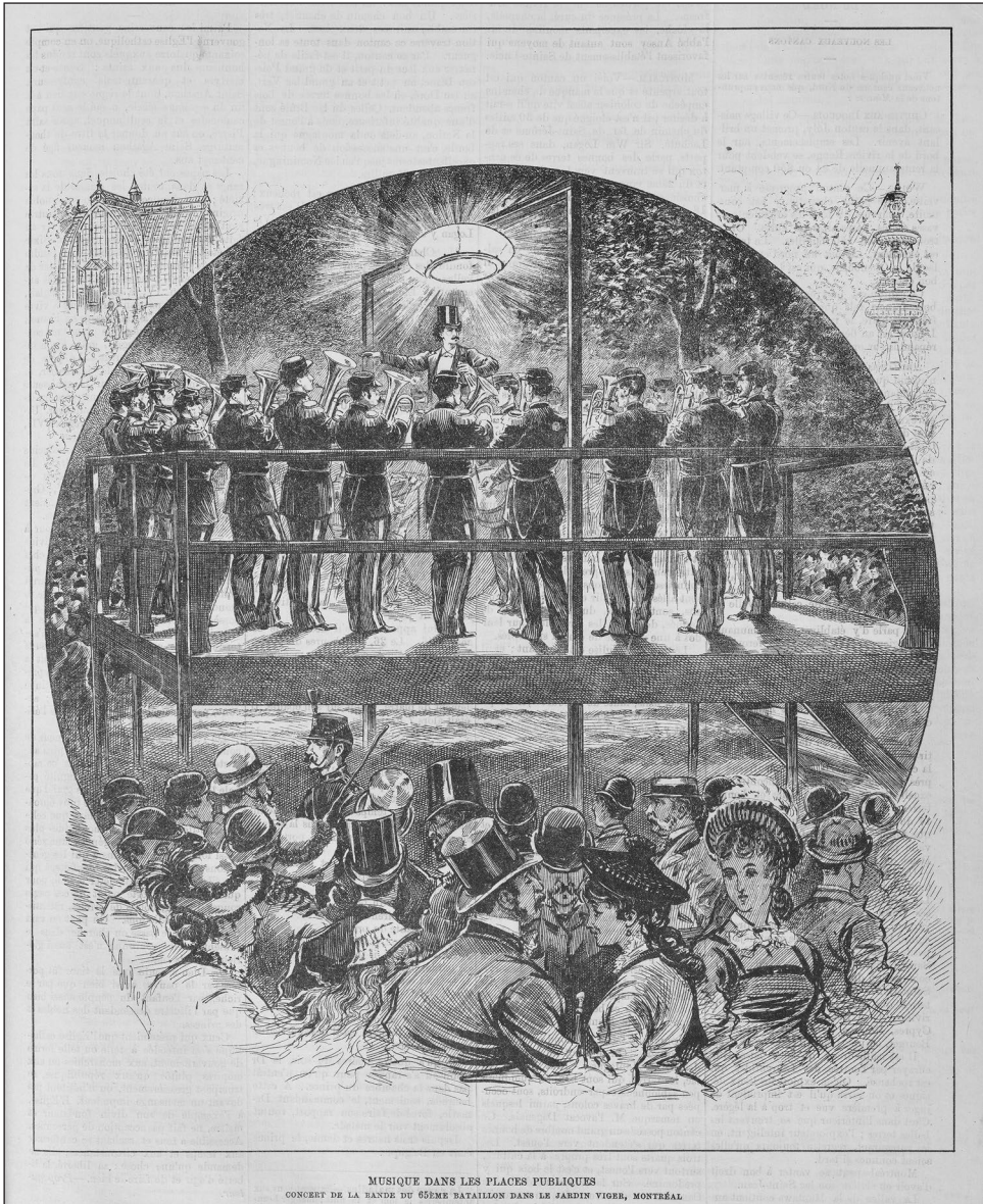
Figure 1 : Musique dans les places publiques. Concert de la bande du 65 e bataillon dans le jardin Viger, Montréal. L'opinion publique , 23 septembre 1880

serre et les vespasiennes. Le square se retrouve seul avec les ouvriers du secteur et les indigents (Choko 1990 ; De Laplante 1990 ; Le patrimoine du Vieux-Montréal en détail 2002 ; Héritage Montréal 2008).