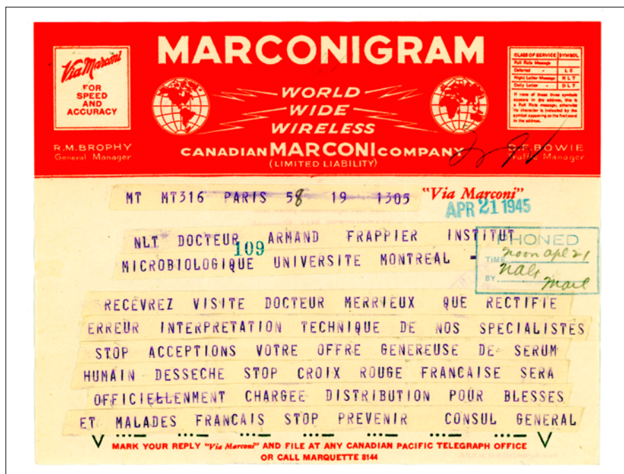
Figure 4: Exemple d'un document qui a été utilisé dans le cadre de notre exposition virtuelle.

choisir quelques excellents documents qui collent bien à nos textes qu'une marée de documents dans laquelle se dilue le propos. J'ai appris avec le temps qu'un des meilleurs critères est de choisir des images montrant des gens. Des édifices, c'est bien beau, mais les personnages sont généralement beaucoup plus évocateurs. De plus, les textes qui font parler les gens sont les meilleurs, d'où le choix de la correspondance.