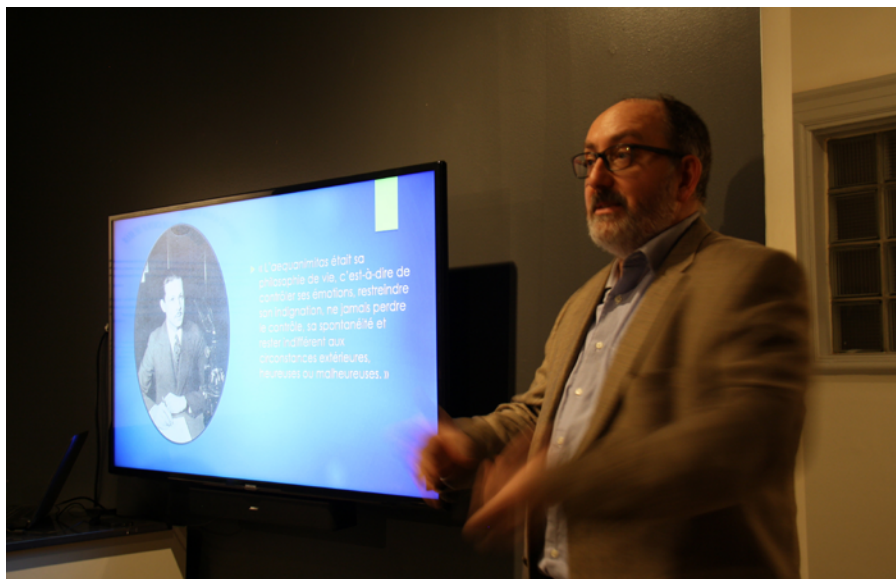
Figure 7: L'auteur pendant une des conférences sur le D' Frappier et son œuvre.

Plus de 110 personnes ont ainsi été rejointes dans le cadre de ces conférences. De plus, le taux de fréquentation de notre exposition virtuelle donne déjà de bons résultats.