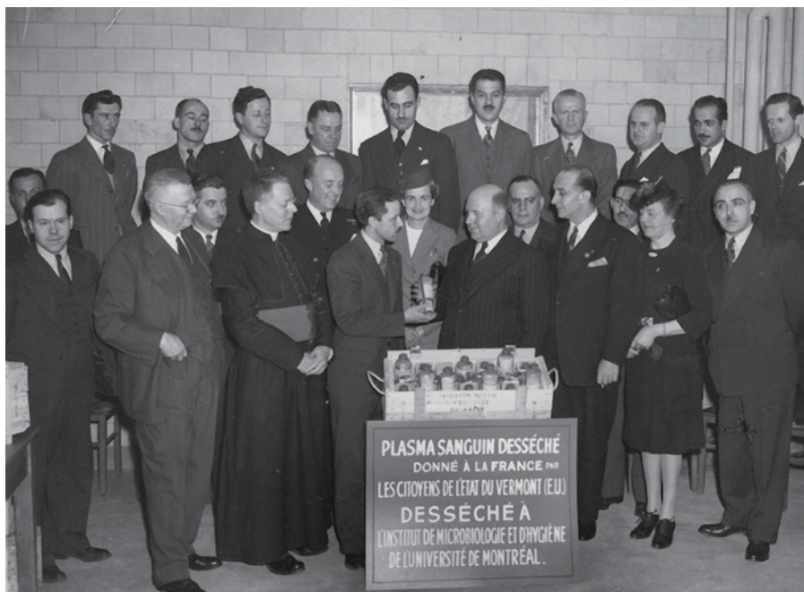
Figure 3 : Don de sang desséché par l'équipe du D r Frappier en 1944 pour le bénéfice des citoyens français éprouvés par la guerre. Fonds de l'Institut Armand-Frappier.

Un projet d'exposition virtuelle a donc été soumis afin de souligner la contribution du D r Frappier et de son équipe à l'effort de guerre du Canada pendant la Seconde Guerre mondiale. Comme il s'agissait de la prolongation du travail effectué grâce à la subvention de BAnQ, je n'ai pas hésité à inclure BAnQ (par le biais de sa subvention) comme un « partenaire » dans notre projet de mise en valeur des archives d'Armand Frappier. Le programme de financement de Patrimoine canadien favorisait en effet la création de partenariats. Le financement obtenu de BAnQ a donc été intégré dans le budget de notre projet comme un apport d'un collaborateur externe. Mon simple projet de traitement commençait donc à se déployer comme une initiative de plus grande envergure. De plus, je prévoyais utiliser certaines pièces du Musée Armand-Frappier dans l'exposition virtuelle que nous allons mettre en ligne 11 . J'ai donc approché le musée et sa directrice afin d'obtenir un soutien additionnel. Une fois cet appui obtenu, j'avais un très bon dossier à présenter à Patrimoine canadien. Avec tous ces atouts en main, il n'est pas surprenant que nous ayons obtenu le financement demandé.