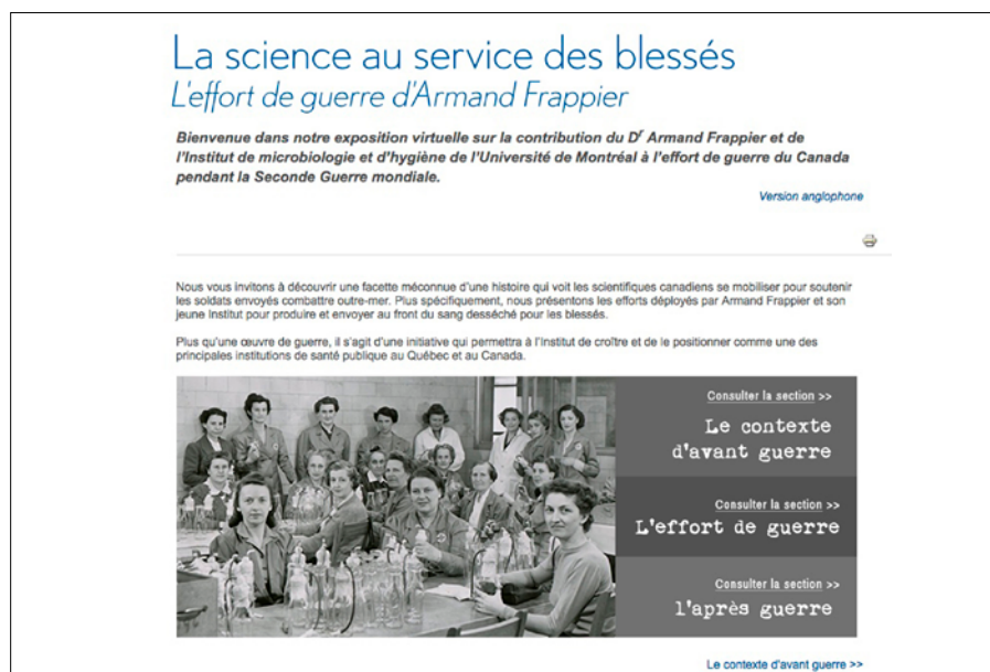
Figure 5: Sobre mais efficace: la page d'accueil de notre exposition virtuelle.

Fort heureusement, nous avons ce plan de rechange: notre propre site Web et mes très compétents collègues du Service des communications de l'INRS. Deux personnes de cette équipe étaient donc prêtes à faire une dernière relecture des textes et à mettre images et textes en ligne dans une interface sobre qui s'harmonisait bien avec le look du site Web de l'INRS.