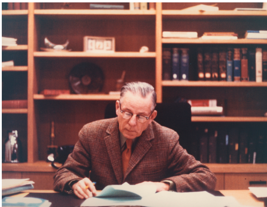
Figure 1 : Armand Frappier dans son bureau, dans les années 1970.

Un inventaire détaillé de ses archives est issu de ce projet et a contribué à donner un premier aperçu du contenu du fonds. Ces archives serviront entre autres à la production d'un documentaire biographique sur le D r Frappier réalisé en 1995 par Nicole Gravel 5 . Par contre, même avec un inventaire détaillé à la clé, le fonds demeure sous-exploité. Il faut noter que même si l'instrument de recherche était remarquablement détaillé, une absence d'indexation rendait son utilisation laborieuse. Sa publication survient aussi avant l'introduction des Règles pour la description des documents d'archives (RDDA) (en 1990), ce qui le rend non conforme au format de description encore en vigueur de nos jours. Toutefois, au-delà de l'importance de son créateur et de son accessibilité limitée, le nouveau traitement de ce fonds a été rendu nécessaire par la présence d'une vingtaine de boîtes de documents supplémentaires qui n'avaient jamais été intégrées au fonds. Il s'agissait de documents que le D r Frappier avait encore en sa possession lors de son décès et qui avaient tout bonnement été rangés sur des tablettes d'un de nos dépôts.