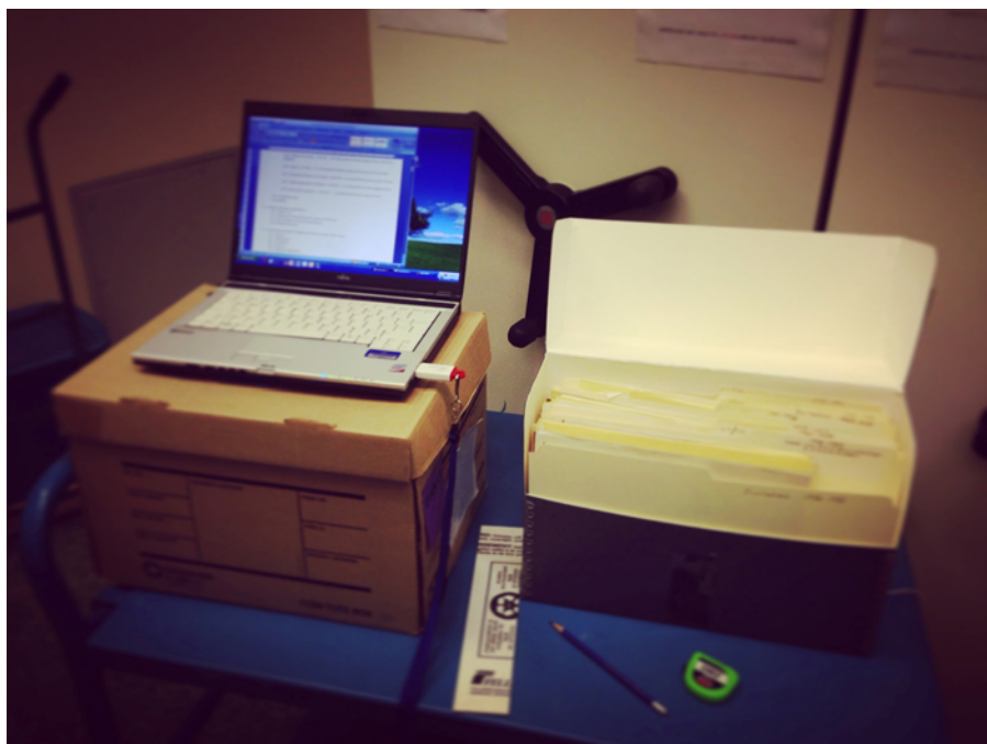
Figure 2: Le fonds Armand-Frappier en voie d'être traité.