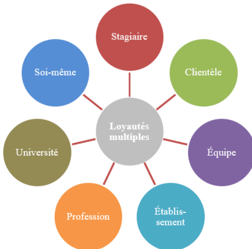
Figure 2. Les loyautés multiples du formateur clinique.

L'ergothérapeute qui supervise maintient diverses loyautés en raison de ses responsabilités professionnelles à l'égard des stagiaires, des clients, de l'équipe avec laquelle il collabore, de l'établissement au sein duquel il évolue, de sa profession, de l'université de provenance des stagiaires et à l'égard de lui-même (voir la Figure 2). Or, conjuguer ces multiples loyautés ne va pas de soi lorsque des conflits se présentent entre elles ou certaines d'entre elles. Par exemple, des participantes ont dit se sentir tiraillées entre les besoins des stagiaires et ceux des clients. Ce faisant, elles vivent des dilemmes éthiques.