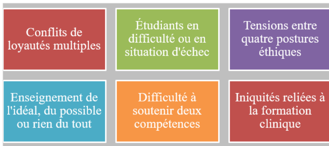
Figure 1. Les enjeux éthiques de la formation clinique.

Bien que des participantes aient tendance à discuter plus aisément et spontanément des enjeux éthiques qu'ils rencontrent comme cliniciens, tous ont rapporté vivre des enjeux éthiques lorsqu'ils supervisent des stagiaires. Six unités de sens émergent des données d'entrevues analysées (voir la Figure 1). Tandis que les conflits de loyautés multiples sont l'enjeu éthique le plus discuté, traiter avec des étudiants en difficulté ou en situation d'échec représente l'enjeu éthique le plus éprouvant pour les formateurs cliniques. Le superviseur vit aussi des tensions entre quatre postures éthiques parfois difficiles à concilier. Il hésite de plus entre enseigner l'idéal ou le possible, voire à prendre des stagiaires, notamment dans le contexte actuel de surcharge de travail, de pression de performance et de reddition de compte. Par ailleurs, des superviseurs se sentent peu outillés pour soutenir le développement des compétences éthiques ou culturelles des étudiants. Enfin, certains superviseurs notent des iniquités en lien avec la formation clinique.