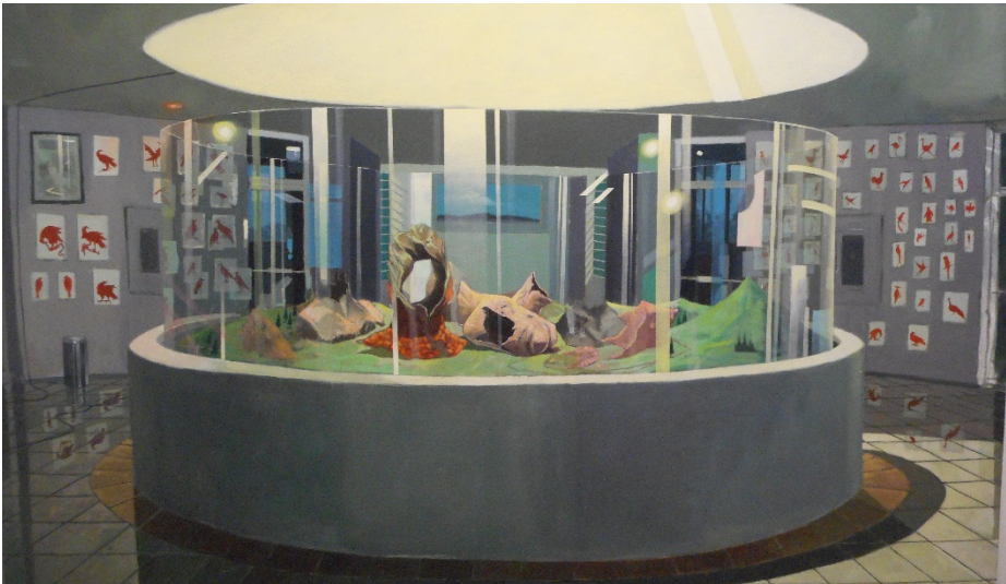
Figura 12. Fotografía de Conversación secreta en el museo hermético, de Denny Navas.