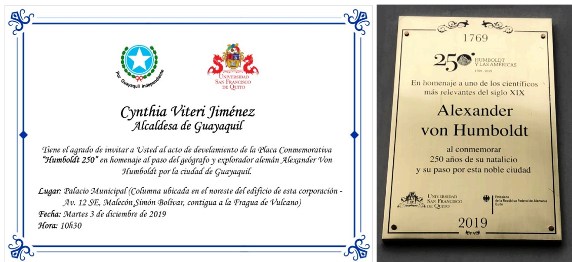
Figura 9. Invitación al evento en Guayaquil.

Uno de los eventos que prometía mayor crítica y rigurosidad analítica sobre Humboldt fue aquel celebrado en FLACSO-Ecuador (Facultad Latinoamericana de Ciencias Sociales) con un gran evento de reflexión sobre el pensamiento de Humboldt desde una perspectiva latinoamericanista. El evento se llamó “La Invención de Humboldt” y contenía en su programa un fuerte cuestionamiento, al fin, a la lectura colonial actual de su figura y su representación en América Latina. 4 La primera conferencia magistral de Jorge Cañizares-Esguerra, de la Universidad de Austin en Texas, fue una demoledora crítica a Andrea Wulf y su best-seller “La Invención de la Naturaleza”. Esta crítica se basó en el paralelismo entre el extractivismo epistémico no reconocido que realizó Humboldt con los intelectuales de su época, y el que, según él, ha cometido Wulf en la actualidad con intelectuales contemporáneos (de forma implícita se refería a estudiosos como él).