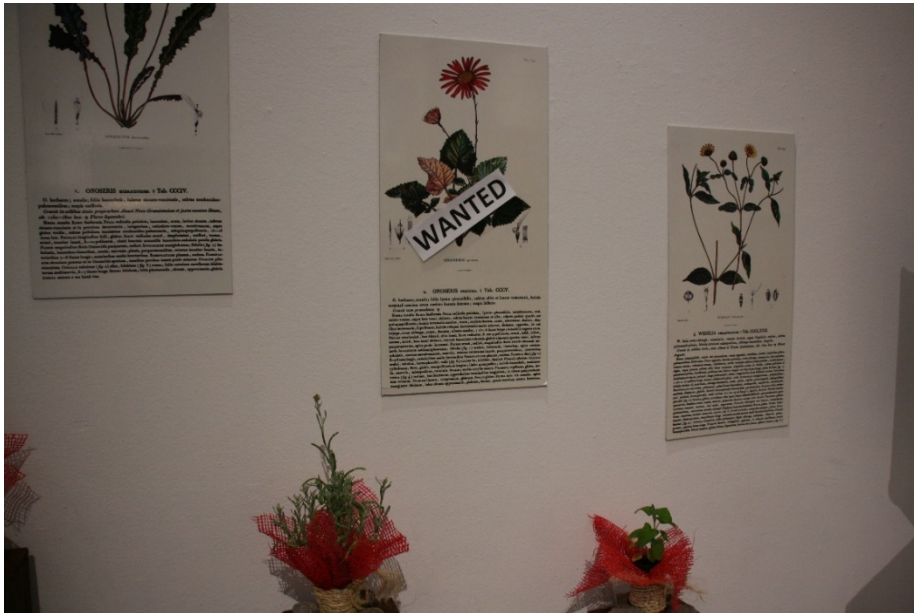
Figura 4. Stand del GAD de Alausí.

En el caso de la revista Ñan , presentaban en la exposición su número 34, un especial sobre Humboldt financiado por la Embajada de la República Federal de Alemania en Quito. La parte más llamativa de su stand, desde nuestro punto de vista, fue el panel donde estaban todos los hombres que lo reconocían. Pese a que la revista es quiteña, los hombres – únicamente hombres – presentes eran todos ellos blancos, a excepción de Simón Bolívar, del que se destacó la frase de que reconocía a Humboldt como el “verdadero descubridor de América”.