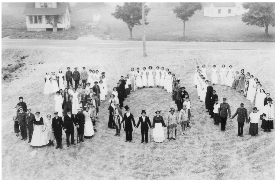
Figure 1 : Les acteurs du « pageant » historique du tricentenaire de Pubnico, 1951.

pourrait mener à un pardon collectif, du moins à la reconnaissance à la fois de la dignité des victimes et des bourreaux. En même temps, ces ouvrages tentent de recentrer la narration historique allemande sur l'apport juif à la nation et sur les réussites allemandes depuis la Deuxième Guerre mondiale.