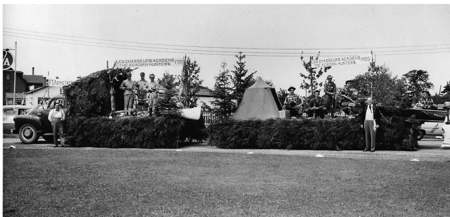
Figure 3 : Char allégorique « Les chasseurs acadiens, 1755-1955 », parade du Bicentenaire à Clare, 1955.

l'œuvre des missions met l'accent sur l'éducation chez les Acadiens et l'avancement des institutions chrétiennes dans la région 46 .