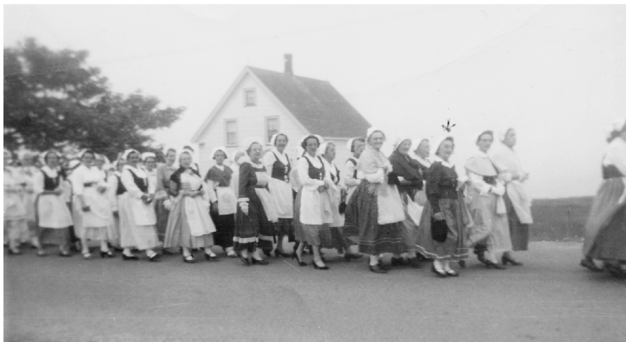
Figure 4 : Participantes costumées à la parade du Bicentenaire à Pubnico-Ouest, 1955.

Évangéline et un gamin en Gabriel au passage de la parade 51 . L'adoption du costume d'Évangéline comme « costume traditionnel acadien » date principalement des fêtes du Bicentenaire, et ce, partout dans les Maritimes 52 . Dans le cadre des fêtes à Clare, cette adoption presque hégémonique est très évidente.