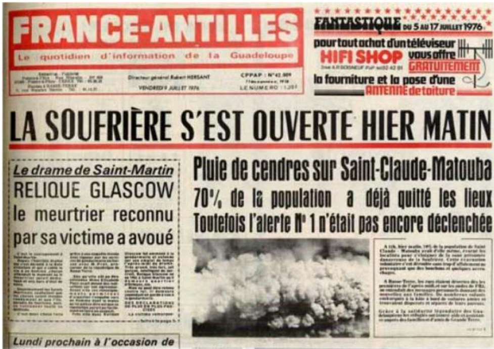
Figure 2. Une du France Antilles du 9 juillet 1976.