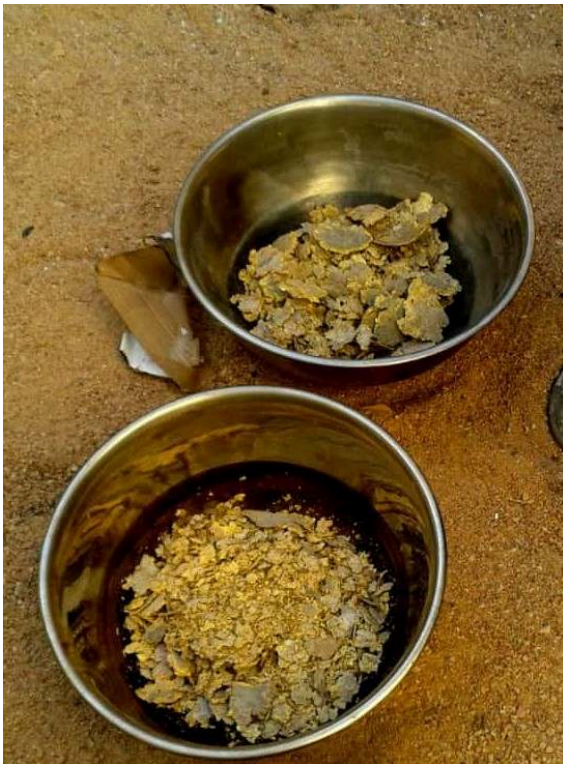
ORPAILLEUR DE TABELOT, 2014 / GOLD DIGGER OF TABELOT, 2014.