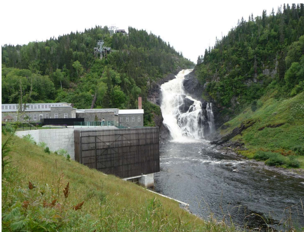
Figure 2. Centrale Val-Jalbert.