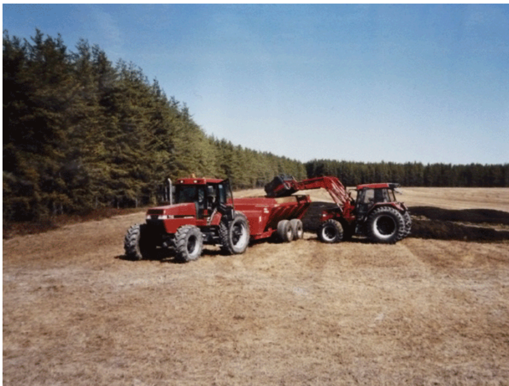
Figure 1. Reprise des biosolides stockés au champ en vue de leur épandage sur une ferme de Saguenay.