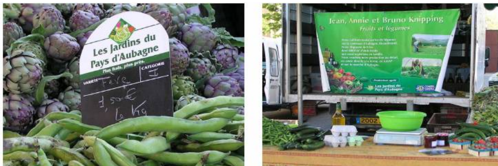
Figure 5. La marque collective Les jardins d'Aubagne, symbole de la volonté collective de maintenir l'agriculture péri-urbaine en Pays d'Aubagne

périurbaines. La ville d'Aubagne a initié une politique agricole périurbaine élargie depuis à la communauté d'agglomération (Figure 5).