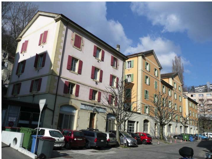
Figure 1. Le quartier du Vallon, un ensemble d'habitations ouvrières.

Si l'on se réfère aux modèles classiques de la gentrification – le rent gap (Smith, 1984 ; Hamnett, 1996) et le life style choice (Ley, 1996) –, tous les ingrédients sont réunis pour faire de cette portion de ville un site propice à une réhabilitation à destination des classes moyennes-supérieures. Du point de vue identitaire, l'image du Vallon se transforme : il devient un « espace-signe » attractif pour des populations désireuses de se démarquer par leur style de vie et qui souhaitent bénéficier d'une localisation centrale. Du point de vue économique, l'existence d'un différentiel très favorable entre la valeur du marché et la valeur potentielle des biens immobiliers présents dans le quartier garantit la rentabilité des investissements potentiels.