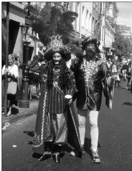
Mardi Gras, Nouvelle-Orléans.

Le trafic de femmes existe comme il a existé par le passé. Storyville est un des lieux particuliers en Amérique du Nord qui a accueilli ce type de trafic, mais il ne fut pas le seul puisque New York, Chicago, Montréal, Boston, Seattle ou San Francisco s'y sont illustrés. Le trafic des femmes à travers l'Europe a été officiellement reconnu en 1877 lors d'une conférence internationale à Genève. En 1902, la France sous la pression de la réalité de la traite des Blanches, organisa une conférence internationale qui aboutit à un « arrangement international en vue d'assurer une protection efficace contre le trafic criminel connu sous le nom de traite des blanches » 9 . Cet agrément fut officiellement ratifié par le Président Roosevelt en 1908 et suivi d'une loi interdisant le trafic de personnes à travers les états ou en provenance de l'étranger, le Mann Act de 1910.