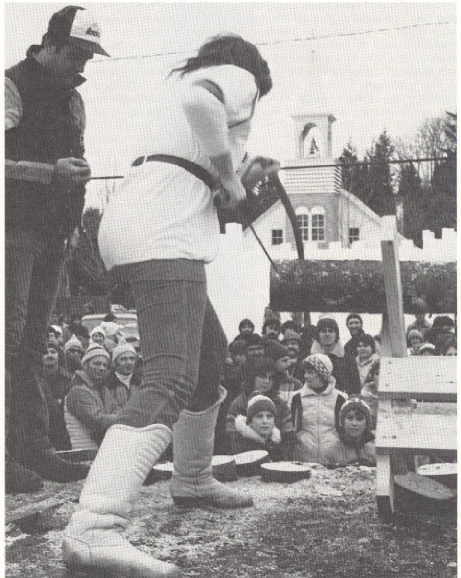
«Dans un immense pays comme le nôtre, les diversités régionales sont plus que dans bien d'autres cas sources d'originalité et de créativité». Les festivals en sont le témoignage.

Le gouvernement fédéral se centre beaucoup plus sur les événements de la culture nationale qui soulignent l'unité, l'union des peuples alors que les Québécois sont axés sur la culture régionale. Le gouvernement d'Ottawa dispose de moyens techniques plus importants, ce qui lui permet d'assurer une permanence aux équipements. Ses réalisations ont l'air plus compétentes, plus professionnelles, mais