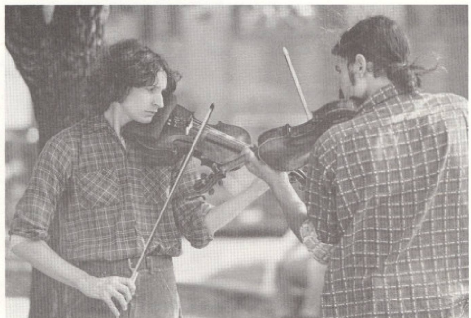
Comment présente-t-on les Québécois?

Mais le Québécois privilégie toujours la culture vécue par rapport à la culture organisée. Les grandes productions, les grandes salles le laissent indifférent; il préfère les festivals, les fêtes, les manifestations populaires. «Il y a toujours,