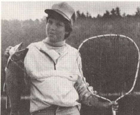
«C'est la certitude d'avoir du gibier qui attire...»