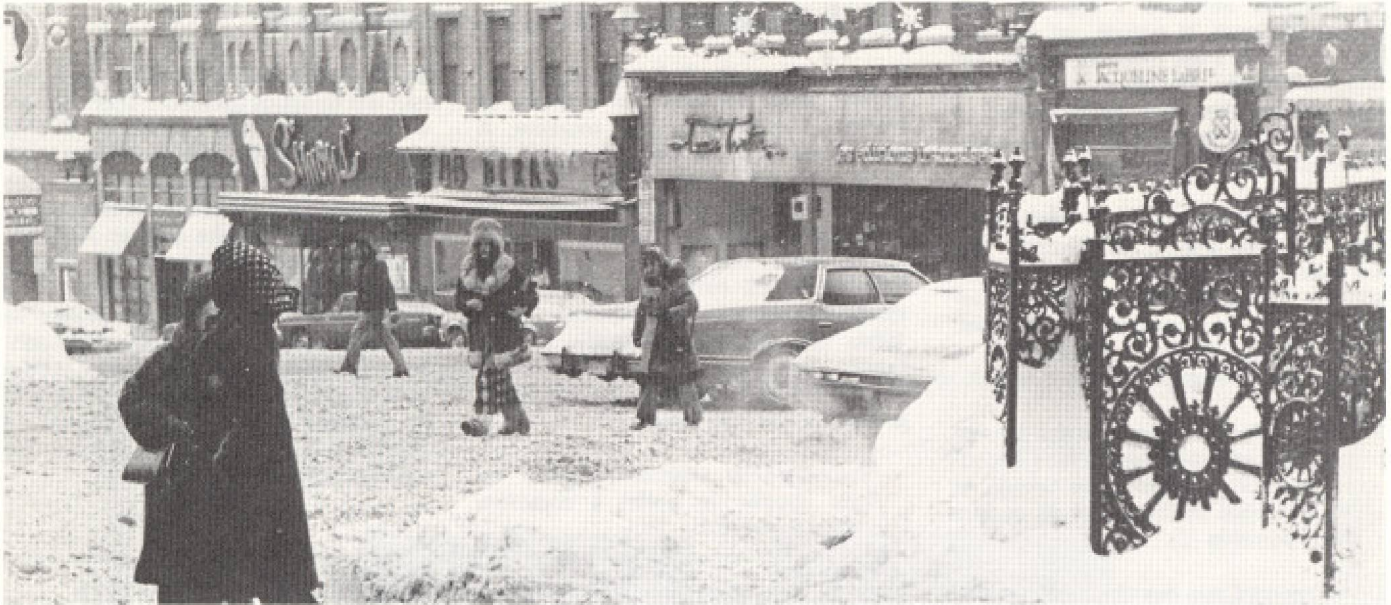
«L'hiver, dans sa globalité, se vend mal...» Ce point de vue d'un voyageur est-il trop radical?

grandes et accroissent énormément le prix du moindre forfait; la promotion de la nature québécoise risque toujours d'être trompeuse.