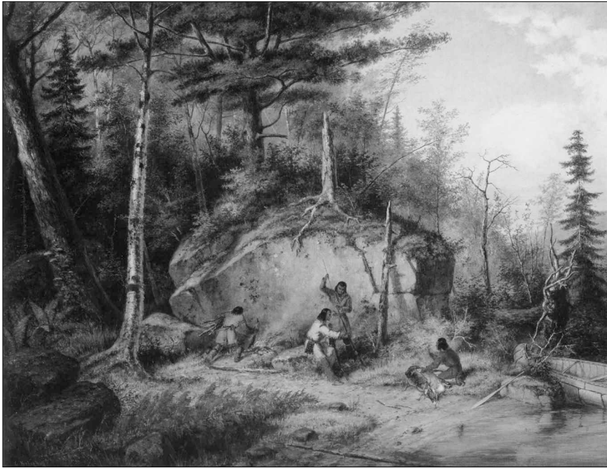
Pendant l'hiver 1705, soixante-dix Abénaquis et des Hurons se rendaient aux environs du lac Saint-Jean sur des terres de chasse « dépendant des Limittes » du poste de Tadoussac (C11A 1705, 25 : 75). [Détail d'une huile de Cornelius Krieghoff, 1862, intitulée « Canadian Autumn, View on the Road to Lake St. John »]

nont point vu d'autres nations chasser sur leurs terres autres que les Papinachois qui sont de leurs mêmes terres » (C11A 1706, 25 : 35).