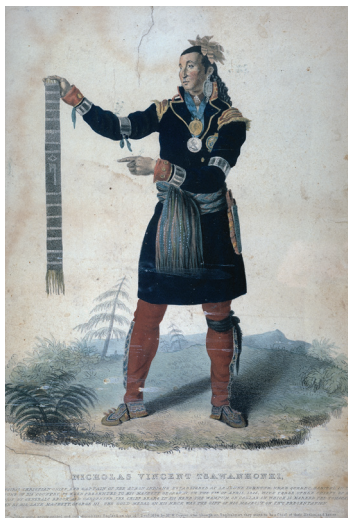
Figure 3. Edward Chatfield, Nicolas Vincent Tsawenhohi, 1825, estampe, 33,3 × 29 cm. Collection du Musée McCord, M20855, don de Mme Walter M. Stewart.