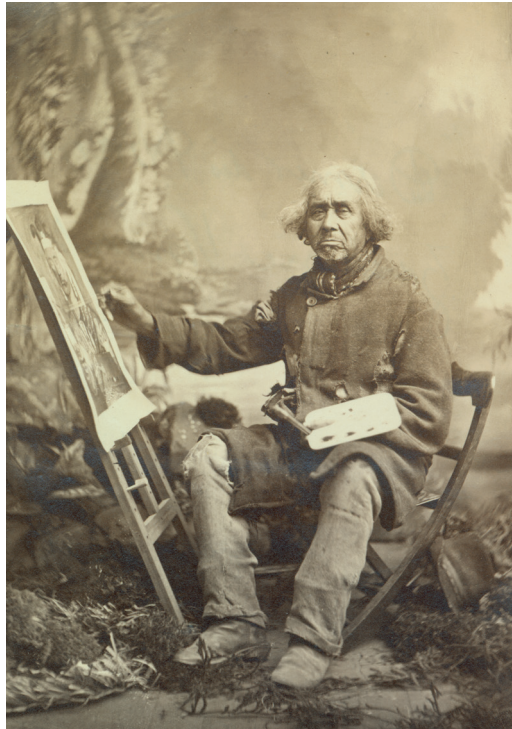
Figure 1. Louis-Prudent Vallée, Zacharie Vincent (Tehariolin), vers 1875–1880. Division de la gestion de documents et des archives de l'Université de Montréal P00581 FP06718.