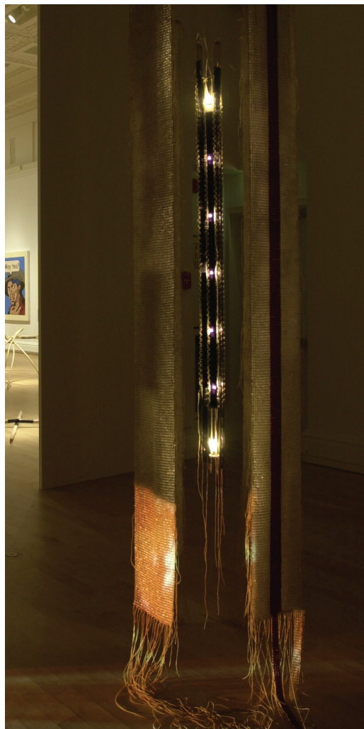
Figure 4. Sonia Robertson, Refaire l'alliance, 2004–2005, installation in situ Collection de l'artiste.