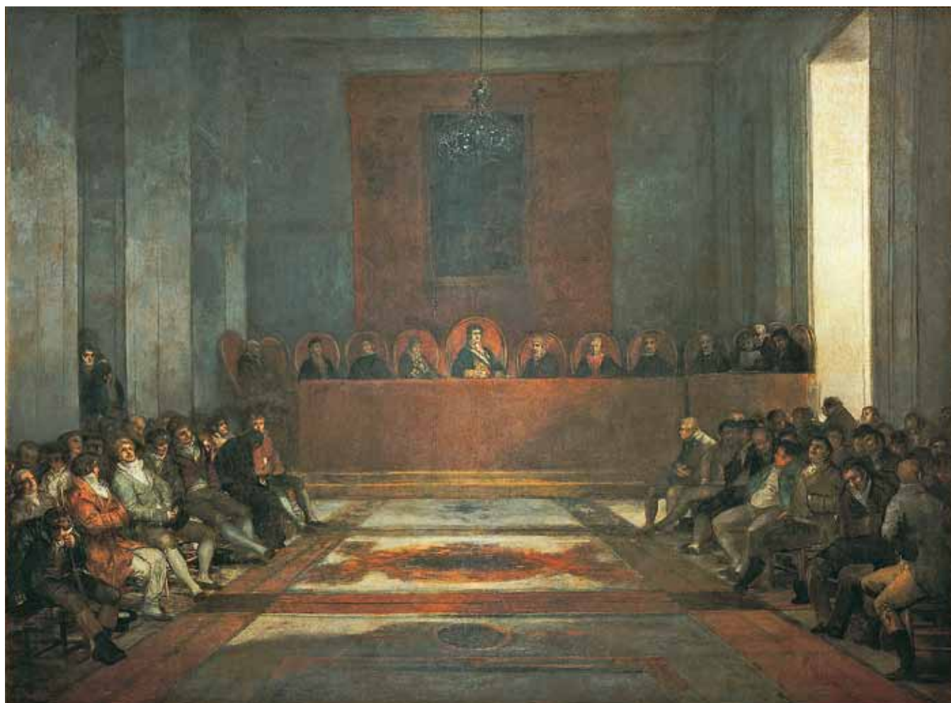
Figure 1. Francisco Goya y Lucientes, La Junte des Philippines , 1815. Huile sur toile, 320,5 x 433,5 cm. Castres, Musée Goya.

orientales » 14 . Sa structure administrative et financière est complexe et se caractérise par une perméabilité entre gestionnaires privés et gestionnaires d'État qu'il ne serait plus possible d'observer de façon aussi prononcée dans les compagnies d'aujourd'hui. Ainsi, le président de la Compagnie des Philippines est le ministre des Indes et le conseil d'administration est entre autres formé d'un représentant des intérêts royaux, d'un représentant de la banque nationale et d'un représentant des intérêts des actionnaires particuliers. Le tableau La Junte des Philippines unit donc des fonctions de représentation du pouvoir politique et du pouvoir économique (les aristocrates et la bourgeoisie, tous deux investisseurs).