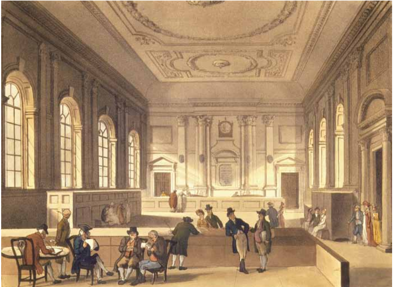
Figure 6. Thomas Rowlandson et Augustus Charles Pugin, South Sea House. Dividend Hall , dans Microcosm of London , 1808–10. Aquarelle rehaussée. Collection privée.

a largement été marginalisé par les études qui lui ont été consacrées : présenté comme un phare solitaire et isolé dans l'histoire de l'art, le tableau n'a été mis en relation qu'aux stricts portraits individuels réalisés par Goya durant l'année 1815 47 . Or, nous postulons que des œuvres anglaises réalisées durant le premier tiers du XIX e siècle forment un ensemble cohérent avec la peinture de Goya 48 , car elles font également état de la société d'investissement qui se met en place entre la fin du XVIII e siècle et l'année 1815, avec Londres comme principal centre de domination 49 . La salle de finance représentée devient un dispositif où s'incarnent et sont déjoués les mécanismes du capitalisme financier du début du XIX e siècle.