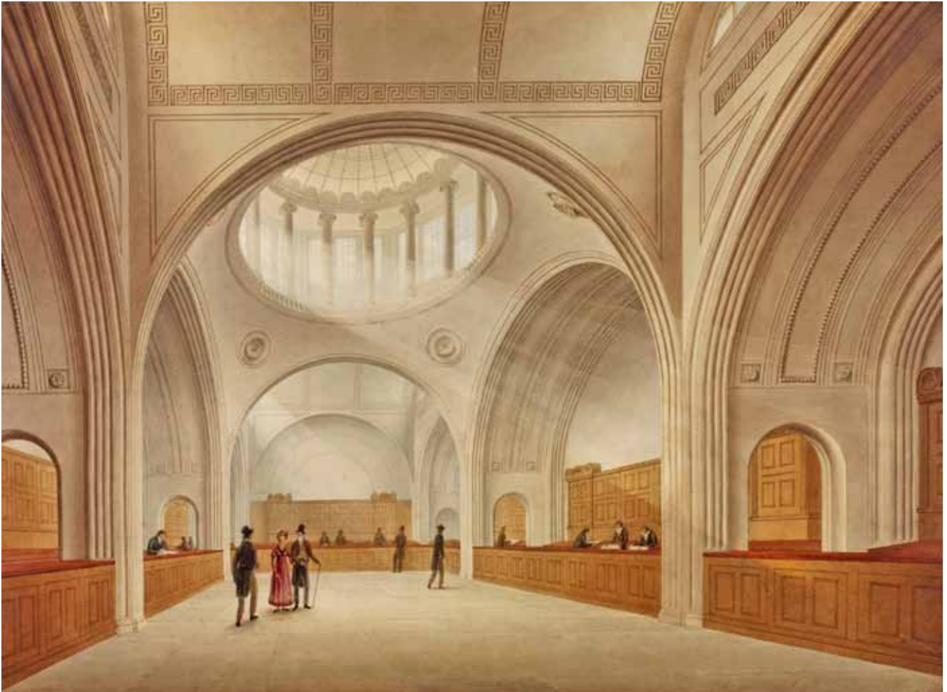
Figure 5. Joseph Michael Gandy, Étude perspective pour le nouveau Bureau du Quatre pour cent , vers 1818–23. Plume et aquarelle, 71,7 × 97,1 cm. Londres, Sir John Soane's Museum (photo : © The Trustees of Sir John Soane's Museum. Photo: Jeremy Butler).

l'encontre de l'imaginaire associé au commerce avec l'Orient et ne semble pas témoigner du rôle fondamental qui était imparti à la compagnie. En faisant l'économie des attributs de l'iconographie allégorique traditionnelle des colonies, La Junte fait des Philippines un réservoir invisible de richesses. La salle est estropiée de tout référent. Néanmoins, cette salle de réunion des actionnaires renseigne-t-elle tout de même le spectateur sur le pouvoir commercial et colonial espagnol de l'époque ?