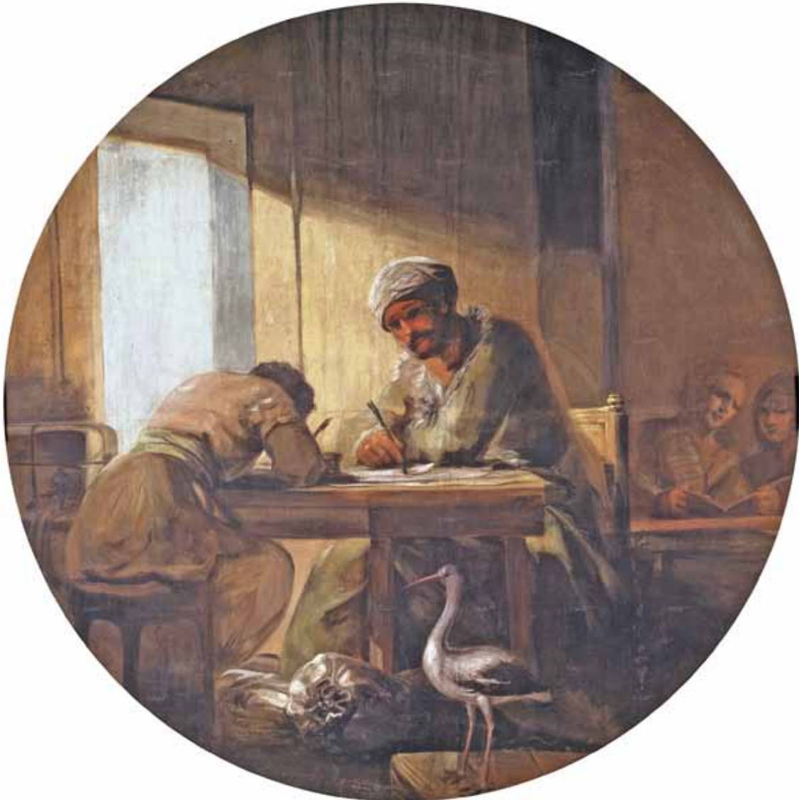
Figure 3. Francisco Goya y Lucientes, Le Commerce , 1801–1805. Détrempe sur toile, 227 cm de diamètre. Madrid, Musée du Prado.

Ce mouvement du commerce international se retrouve accentué dans la page de garde de l'action où une nette division est établie entre la terre à gauche et la mer à droite. Le côté « terre » place le spectateur dans les territoires coloniaux, car il est associé à la représentation du règne animal asiatique : l'éléphant. D'après nous, il est fort probable que l'artiste Cosme Acuña, auteur du dessin de l'estampe, se soit inspiré de la venue en Espagne d'un éléphant au cours de l'année 1773, cadeau du gouverneur des Philippines au roi Charles III 27 (roi fondateur de la Real Compañía de Filipinas ). De plus, l'examen comparé à la loupe de