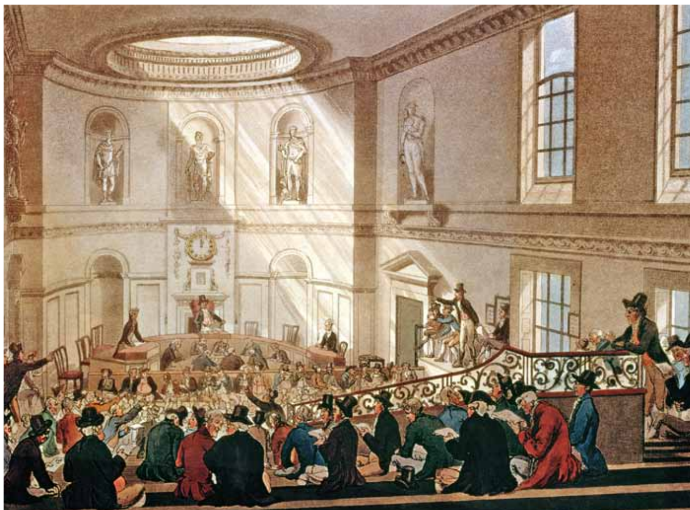
Figure 7. Thomas Rowlandson et Augustus Charles Pugin. India House. The Sale Room , dans Microcosm of London , 1808–10. Aquarelle rehaussée. Collection privée.

Rowlandson et Augustus Pugin. Ce dernier était responsable de reproduire les décors architecturaux tandis que Rowlandson y ajoutait les personnages. Dans le troisième volume du Microcosm , une description textuelle est dédiée à l'un des lieux où se tenait l'activité boursière de Londres : la South Sea House, siège de la South Sea Company . La South Sea Company était une compagnie commerciale chargée de commercer avec les colonies espagnoles de l'Amérique du Sud. Cette compagnie a marqué l'histoire économique de l'Angleterre pour avoir provoqué une bulle spéculative majeure, dont les conséquences ont entre autres été virulemment dépeintes par Hogarth. La planche qui accompagne le texte dans le Microcosm représente le Dividend Hall (fig. 6). C'est un lieu à la fonction très précise — donner les dividendes aux actionnaires — dessiné avec exactitude et présenté au lecteur de façon à en favoriser une appropriation : le lecteur-spectateur sait com-