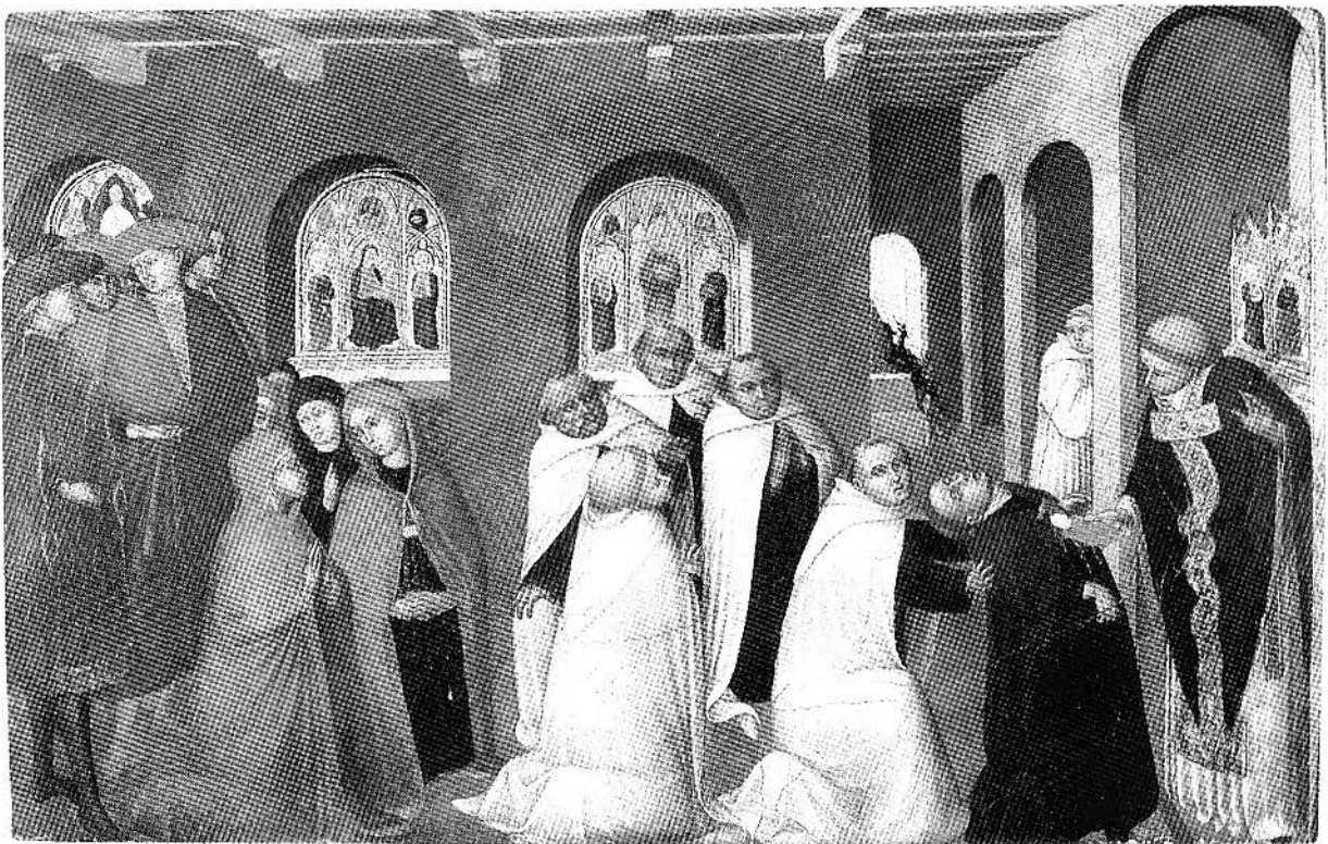
Figure 4. Stefano di Giovanni Sassetta, Le miracle du sacrement , vers 1430-32, tempera et or sur panneau, 24, 1 x 38, 2 cm, Durham, Barnard Castle, Bowes Museum (PD-Art ; http://commons.wikimedia.org/wiki/File:Miracle-of-the-sacrament--_sassetta--museum_Bows.jpg ).

Pourquoi cet intérêt de la part des historiens de l'art pour les insectes? Peut-être renferme-t-elle un élément de réponse dans la signification générale du terme imago . En plus de contenir le sens premier de représentation, de portrait, imago désigne dans le vocabulaire de la zoologie l'état définitif des insectes à métamorphoses. Le même terme, adopté par Freud, renvoie à une vision intérieure liée à la mémoire et à l'affectivité que l'on a d'un être ou d'une chose. Ce qui apparaît de manière plus évidente, c'est que chacun des moments théoriques pensés à travers un insecte renvoie au processus de figurabilité qui caractérise le travail du rêve, le travail de présentabilité des images propres aux formations de l'inconscient. Le concept de figurabilité permet de constater que toute image se présente comme représentant quelque chose 7 . En portant une attention particulière au problème de la relation entre l'œuvre d'art et le traitement du sujet, nous pouvons voir comment s'articulent les propositions des artistes et leur portée pour la peinture au plan pictural, c'est-à-dire