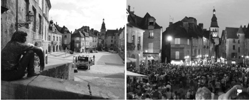
Figure 5 : La place de la Liberté à Sarlat. À gauche, en mars 2015 et à droite en août 2015

Sarlat et la vaste majorité des Dinannais continue de les fréquenter en été. Ces lieux dinannais évoluent par conséquent de lieux communs à dominante citadine à des lieux communs hybrides.