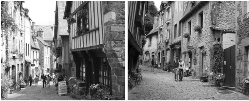
Figure 4 : Rue du Jerzual à Dinan