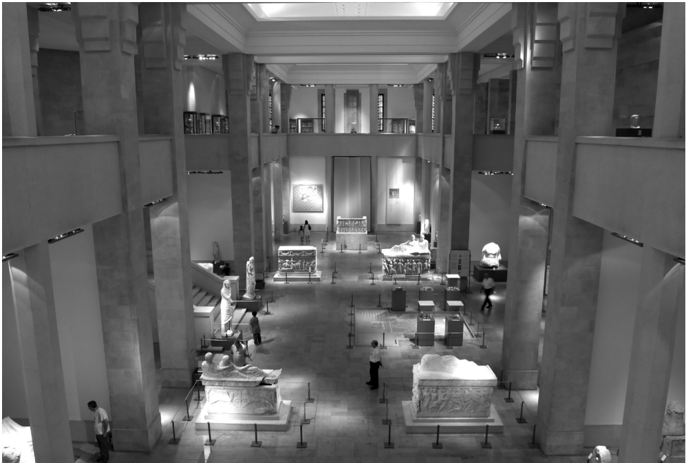
Vue de l'intérieur du musée national de Beyrouth