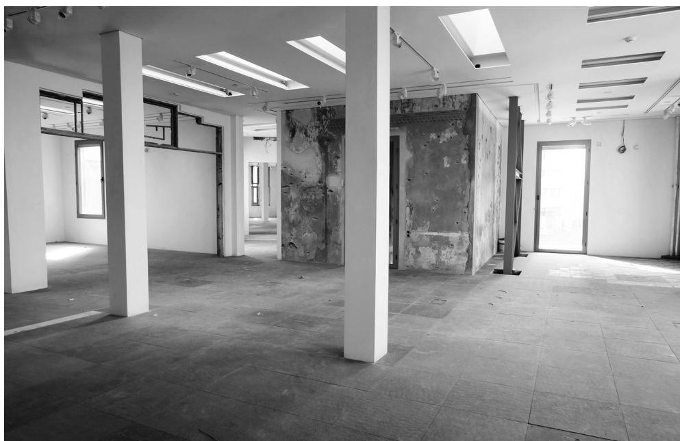
Beit Beyrouth: le 3 ème étage