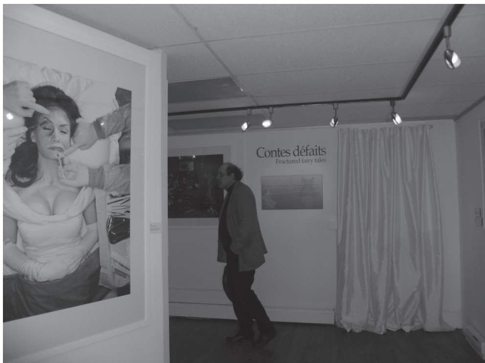
Vue à l'entrée de l'exposition temporaire Contes défaits.