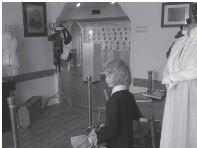
Vue d'une des salles de l'exposition permanente 400 ans d'histoire au féminin.