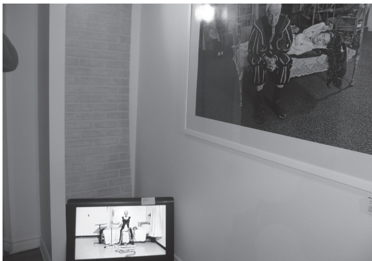
Vue à la fin du parcours de Contes défaits de la vidéo de l'artiste expliquant sa démarche.