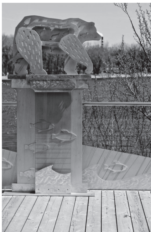
Jean-Pierre Gaudreau, Les îles du musée (détail), 2011, sculptures, aluminium et verre, Boréal, centre d'histoire de l'industrie papetière.