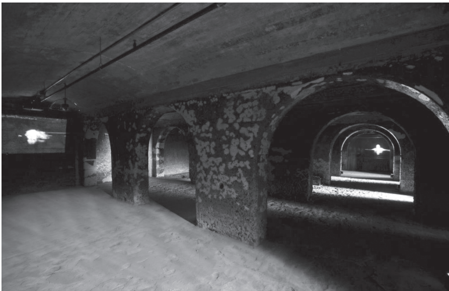
Charles Guillemette, Le parcours des oubliés , 2010, installation vidéo, Boréal, centre d'histoire de l'industrie papetière. [Capture d'écran : Rébecca Lemay-Perreault, 2015.]