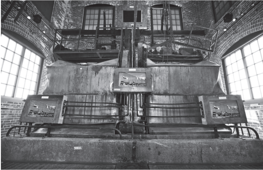
Caroline Saint-Pierre, L'odyssée de la tour. De la capitale du papier à la capitale de la poésie , 2010, installation vidéo, Boréal, centre d'histoire de l'industrie papetière.