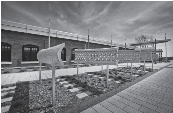
Roger Gaudreau, Deltoïde du Saint-Maurice , 2011, sculpture, bois (peuplier deltoïde), Boréal, centre d'histoire de l'industrie papetière.

[Capture d'écran : Rébéca Lemay-Perreault, 2015.]