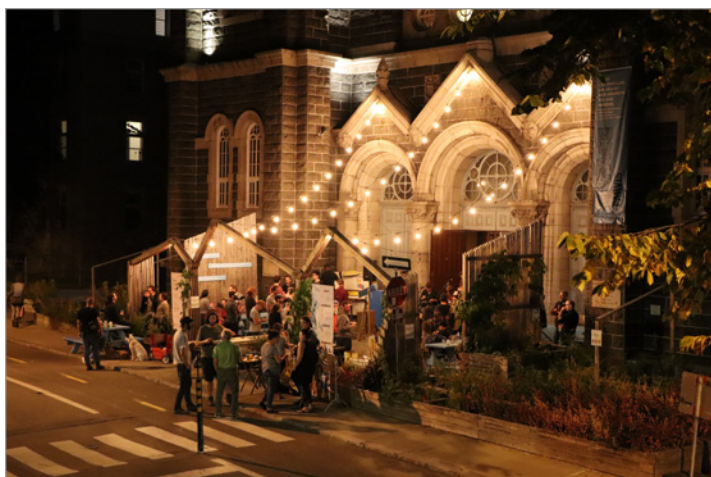
ILL. 4. ÉVÈNEMENT « FabriQC » (ÉCOLE À IMPACT SOCIAL), PARVIS DE L'ÉGLISE SAINT-CHARLES DE LIMOILOU, SEPTEMBRE 2019.