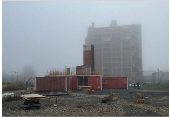
ILL. 10. L'AMBIANCE DE PAYSAGE INDUSTRIEL DU SITE DES PROJETS ÉPHÉMÈRES, DU VIRAGE ET DE L'ÉDIFICE DU 400, AVENUE ATLANTIC. | MARYLÈNE PERRAS.

de Smet définit trois groupes d'acteurs et d'objectifs menant à la réalisation d'espaces temporaires : l'opportunisme (qui profite d'une situation spécifique), l'activisme (qui milite pour une cause en adoptant une attitude critique) et l'auto-organisation (qui porte l'idéologie de produire une ville meilleure par une approche bottom up ). Le Virage 31 répond particulièrement aux premier et troisième groupes et pourrait être « un exemple d'urbanisme temporaire qualifié d'assemblages précaires d'expressions matérielles et identitaires 32 ». Le Virage n'est ni militant ni revendicateur, mais s'inscrit néanmoins dans la remise en cause de l'urbanisme néolibéral 33 . Approuvé d'entrée de jeu par des institutions publiques, il est né de l'opportunité d'investir une parcelle de terrain appartenant à l'Université de Montréal sur son futur campus MIL et d'un financement obtenu de la Ville de Montréal en vertu du Plan de développement urbain, économique et social (PDUES) des secteurs Marconi-Alexandra, Atlantic, Beaumont et De Castelnau. C'est ainsi qu'un terrain expérimental contrôlé et un financement ont été obtenus 34 . La démarche a été initiée et réalisée conjointement entre