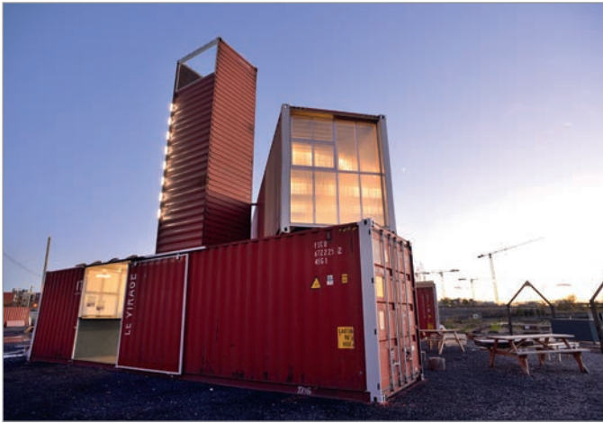
ILL. 9. LE VIRAGE ET L'ARCHITECTURE LUMINEUSE DES CONTENEURS COMME « SIGNAL » URBAIN. | MARYLÈNE PERRAS.