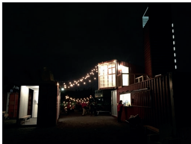
ILL. 34. LE VIRAGE LA NUIT. | JONATHAN CHA.

publics tels le Virage et NDSM insufflent une dose de liberté, d'indétermination et d'incertitude 92 qui attirent ceux qui délaissent les espaces publics traditionnels centraux critiqués pour leur « tendance à leur normalisation, fonctionnalisation, sécurisation et privatisation 93 » ou leur « spécialisation 94 ».