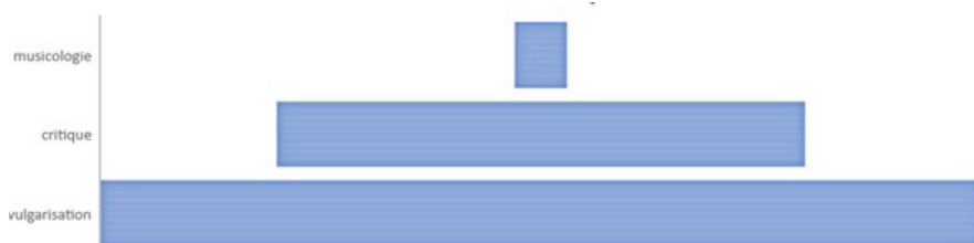
Figure 1: Représentation scalaire des discours sur la musique

Quand la radio est pensée comme un espace de contact entre un public pré-supposé non-initié et des musicologues estampillés experts, tout ce qui se dit sur les ondes est enfermé dans une vision scalaire de la pédagogie. Dans cette représentation pyramidale, ascensionnelle, de la musicologie à la radio, tout ce qui est fait pour démocratiser les musiques savantes revient à répartir ses discours d'accompagnement sur différents paliers et réduire toute parole sur la musique à son niveau de difficulté, sur un seul axe qui va du plus accessible au plus spécialisé.