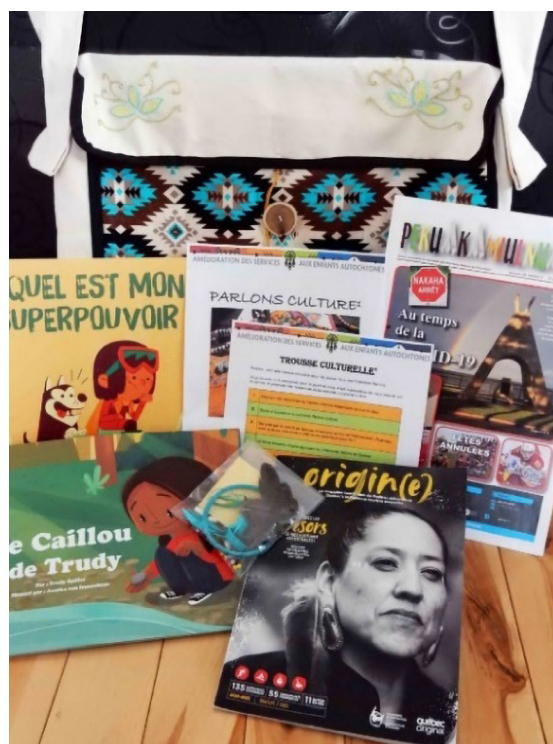
Figure 3 Exemple d'une trousse culturelle

que l'enfant s'adapte bien à son nouveau milieu de vie et lui donner des repères concrets liés à sa culture, à sa langue et au territoire. Ils ont aussi comme objectifs de renforcer la confiance et le dialogue entre le milieu d'accueil et le jeune. Chaque trousse culturelle comprend également un bottin des services offerts par le Centre d'amitié, une liste des ressources autochtones de la région ainsi qu'un conte ou un roman visant à favoriser la transmission des valeurs, des légendes et des coutumes des Premières Nations. Les trousse peuvent être bonifiées en fonction des besoins, des passions et des intérêts du jeune.